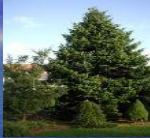
пихта Нордмана ( Abies nordmanniana )