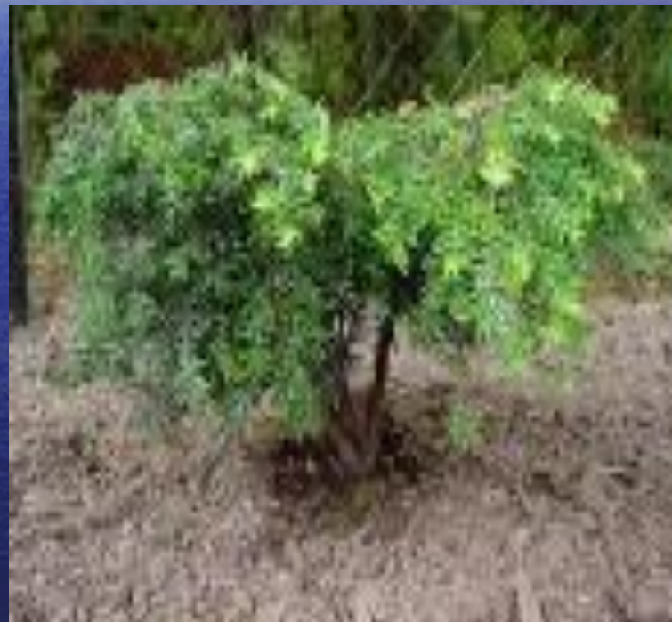
канадская цуга ( Tsuga canadensis )