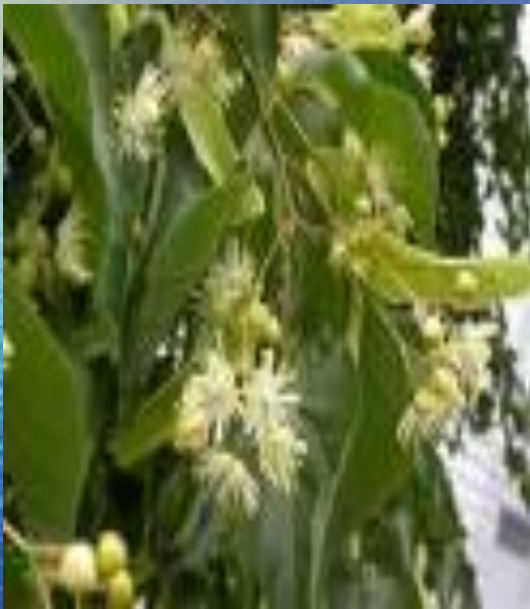
липа сердцевидная ( Tilia cordata )