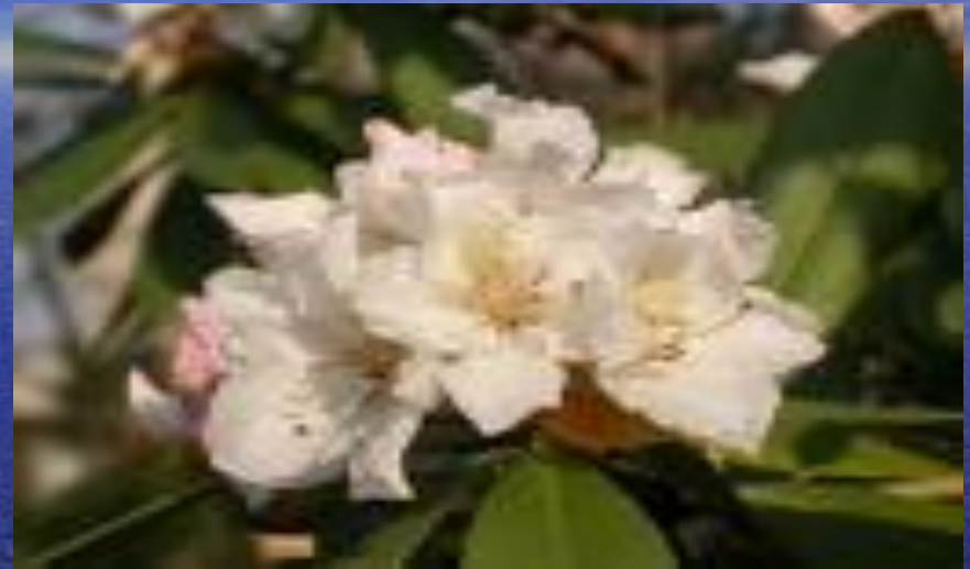
кавказский рододендрон ( Rhododendron caucasicum )