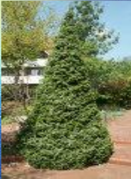
ель Picea omorika