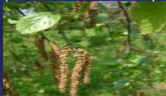
береза Радда( Betula raddeana )