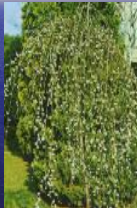
ива ( Salix arctica )