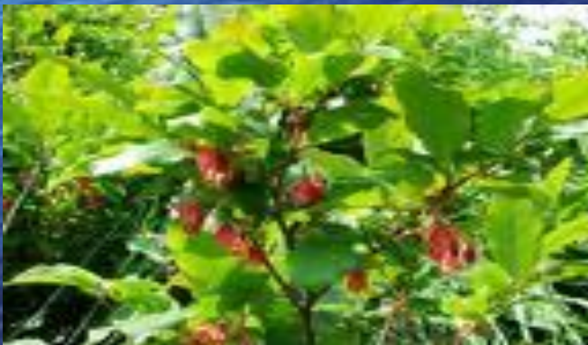
древовидная черника ( Vaccinium arctostaphylos )