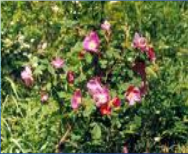
шиповник иглистый ( Rosa acicularis )