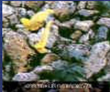
хохлатка Городкова ( Corydalis gorodkovii )