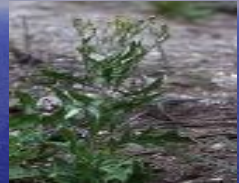
гулявник волжский ( Sisymbrium wolgensis )