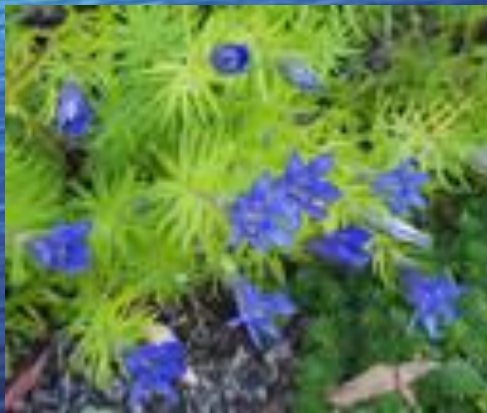
парадоксальная генциана ( Gentiana paradoxa )