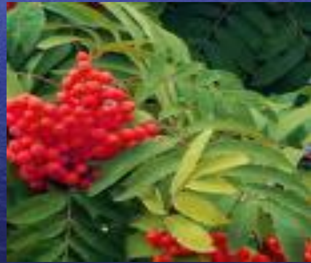
сибирская рябина ( Sorbus aucuparia subsp. sibirica ).