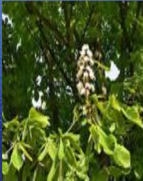
конский каштан ( Aesculus hippocastanum ),