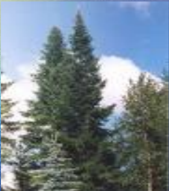
сибирская пихта ( Abies sibirica )