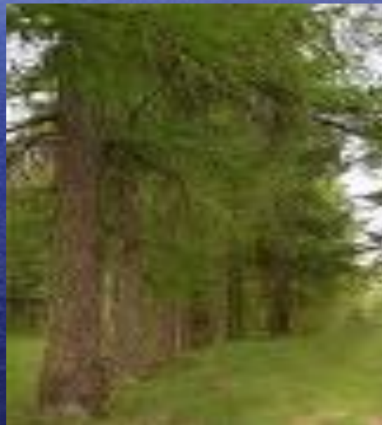
сибирская лиственница ( Larix sibirica )