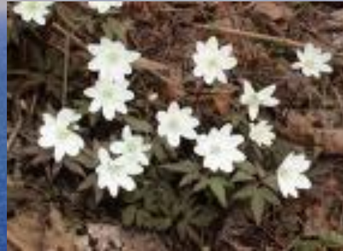
ветреница ( Anemone uralensis )