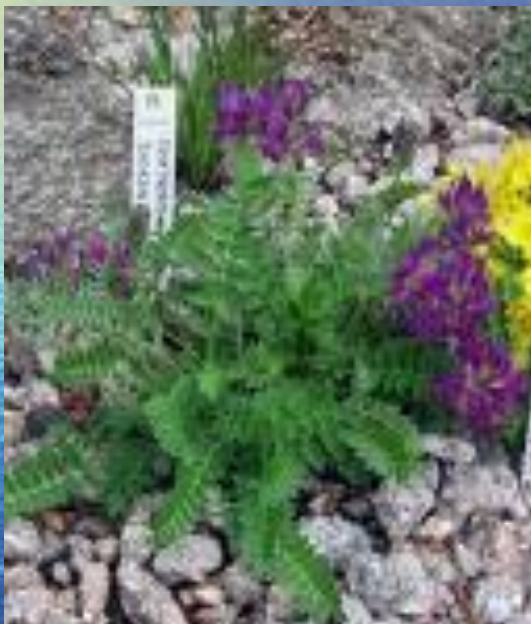
остролодочник ( Oxytropis )