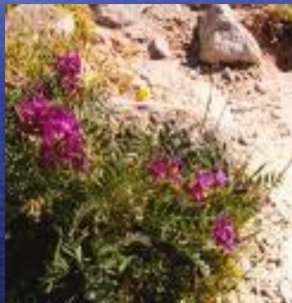
астрагал ( Astragalus ).