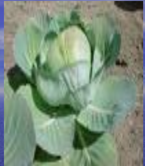
Borodinia · Botschantzevia