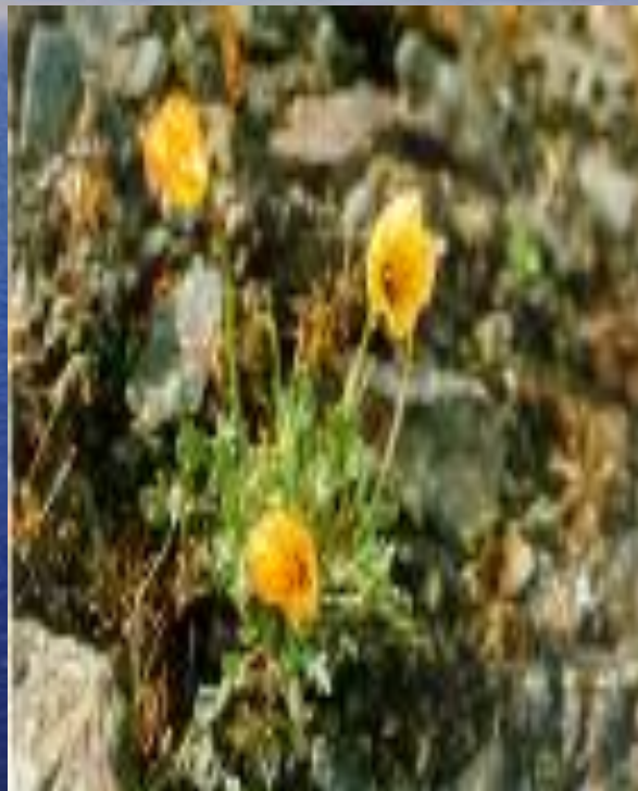
мак ( Papaver polare )