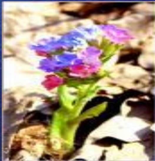
род Pulmonaria (медуница) семейство геснериевых —