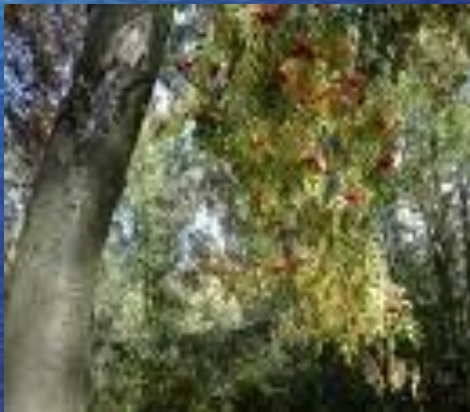
груша русская ( Pyrus rossica )