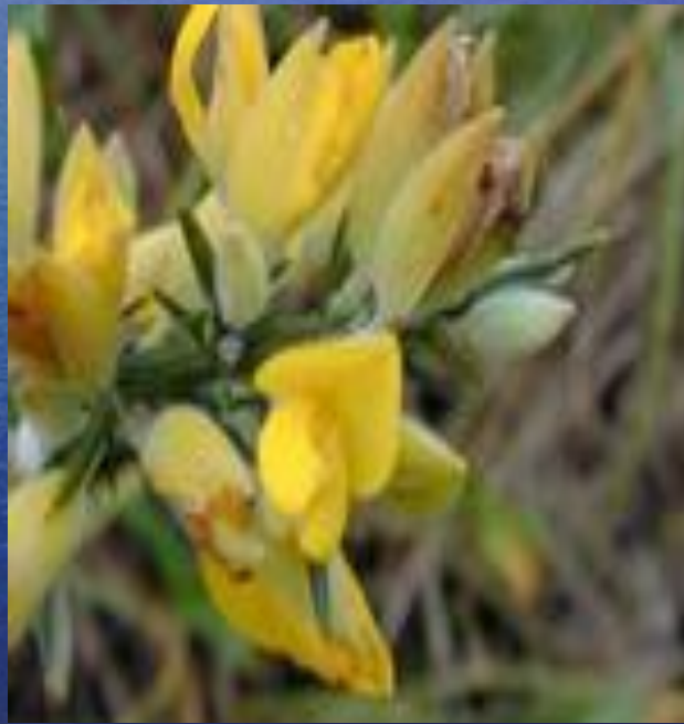
европейский утесник ( Ulex europaeus )