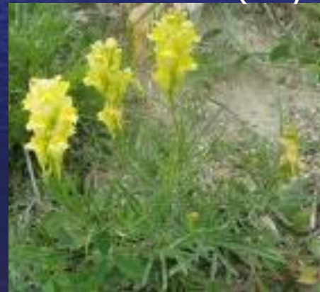
льнянка ( Linaria cretacea )