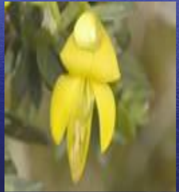
английский дрок ( Genista anglica ),