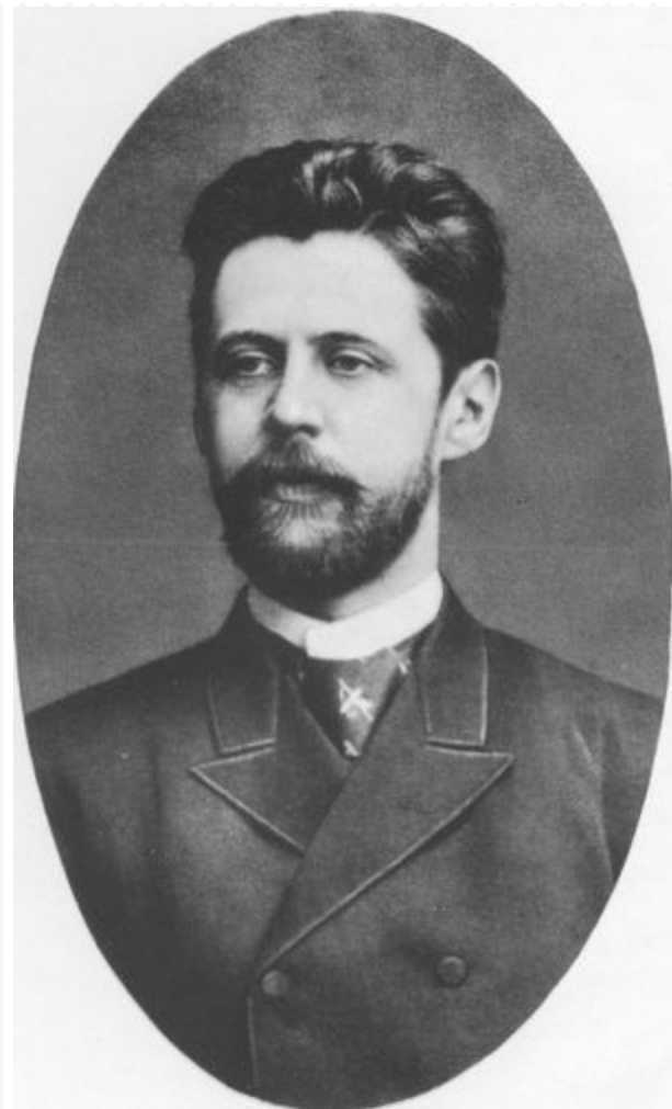
И. Ф. Анненский

И. Ф. Анненский родился в Омске, вскоре семья переехала в Петербург. В автобиографии будущий поэт сообщал, что вырос "в среде, где соединялись элементы бюрократические и помещичьи". "С детства любил заниматься историей и словесностью и чувствовал антипатию ко всему элементарному и банально-ясному". Писать стихи Анненский начал довольно рано. Так как в 1870-е годы понятие "символизм" не было еще ему известно, он называл себя мистиком и "бредил религиозным жанром" испанского художника XVI в. Б. Э. Мурильо, который и "старался „оформлять словами"". Следуя совету своего старшего брата, известного экономиста и публициста Н. Ф. Анненского, считавшего, что до тридцати лет не надо публиковаться, молодой поэт не предназначал свои поэтические опыты для печати. В университетские годы изучение древних языков и античности на время вытеснило стихотворчество; по признанию поэта, он ничего не писал, кроме диссертаций. После университета началась "педагогически-административная" деятельность, которая, по мнению его коллег-античников, отвлекала Анненского от "строгих научных занятий", а по мнению сочувствующих его