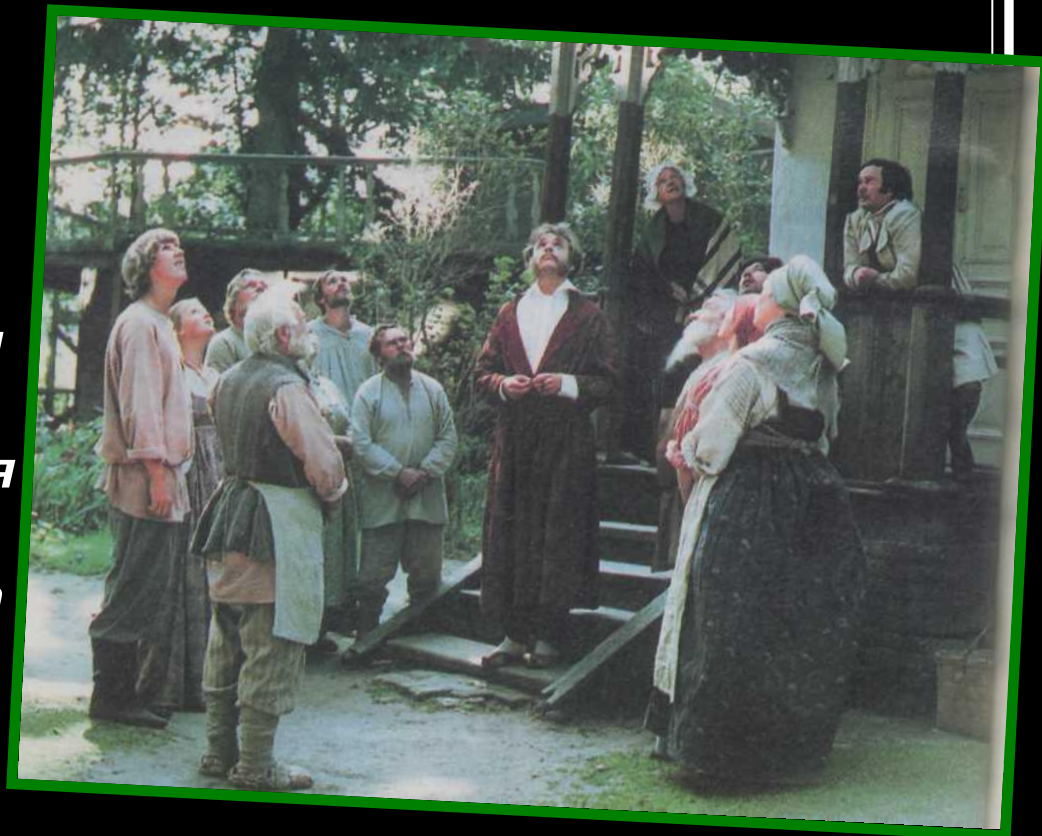
Кадр из фильма «Несколько дней из жизни И. И. Обломова»

4. Почему Обломов любит крапивой, рябиной у дома Пшеницыной, предпочитает тихую, спокойную местность и деревенский быт?