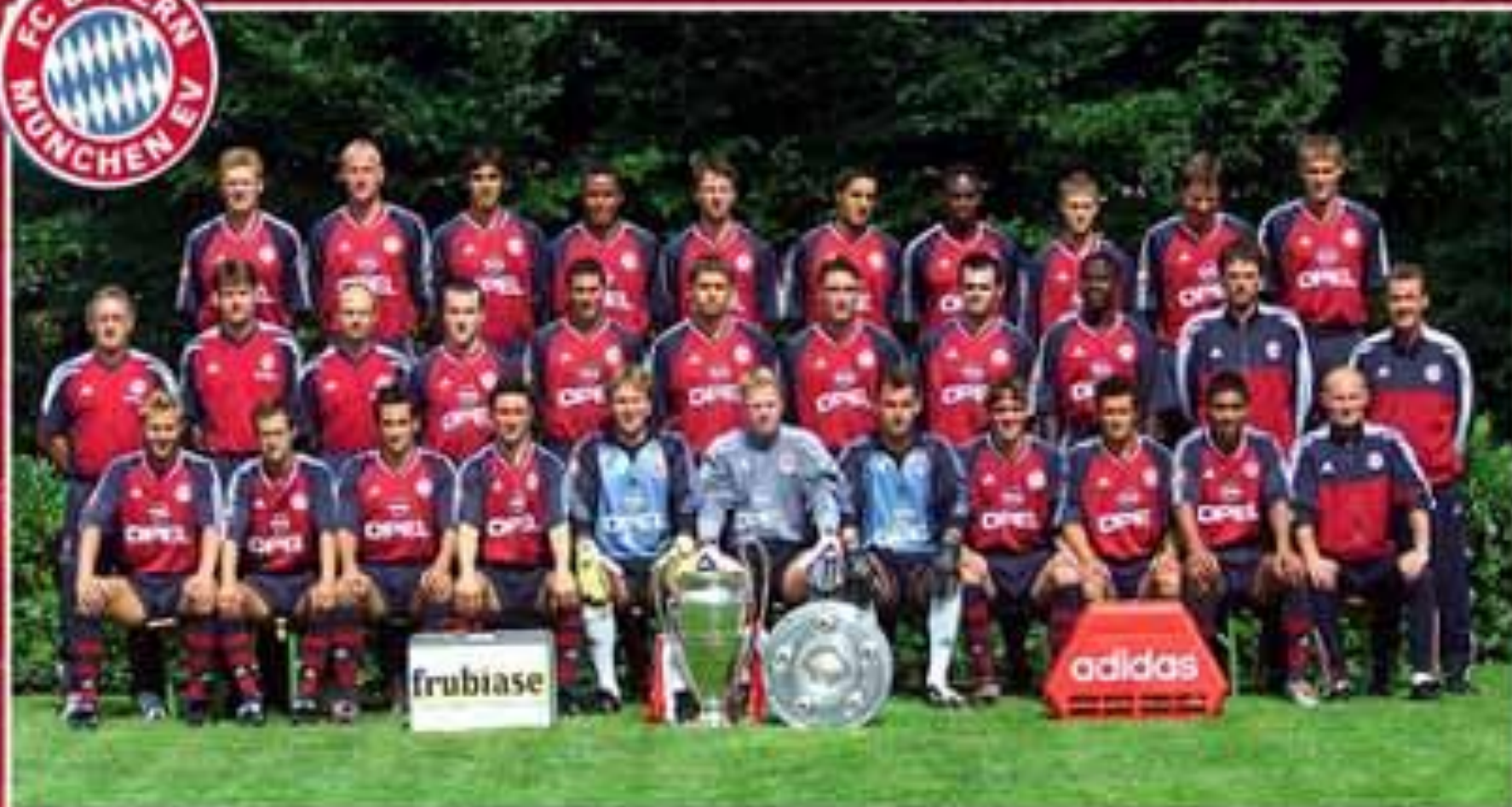
FC Bayern München 2001/2002