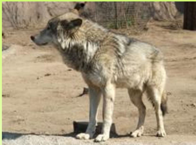
Волк в Московском зоопарке