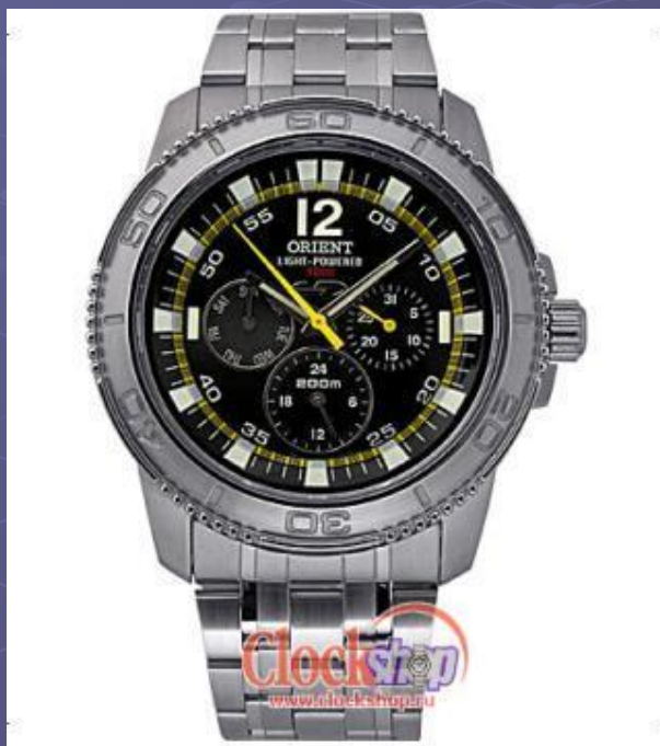
Часы, работающие на солнечной энергии