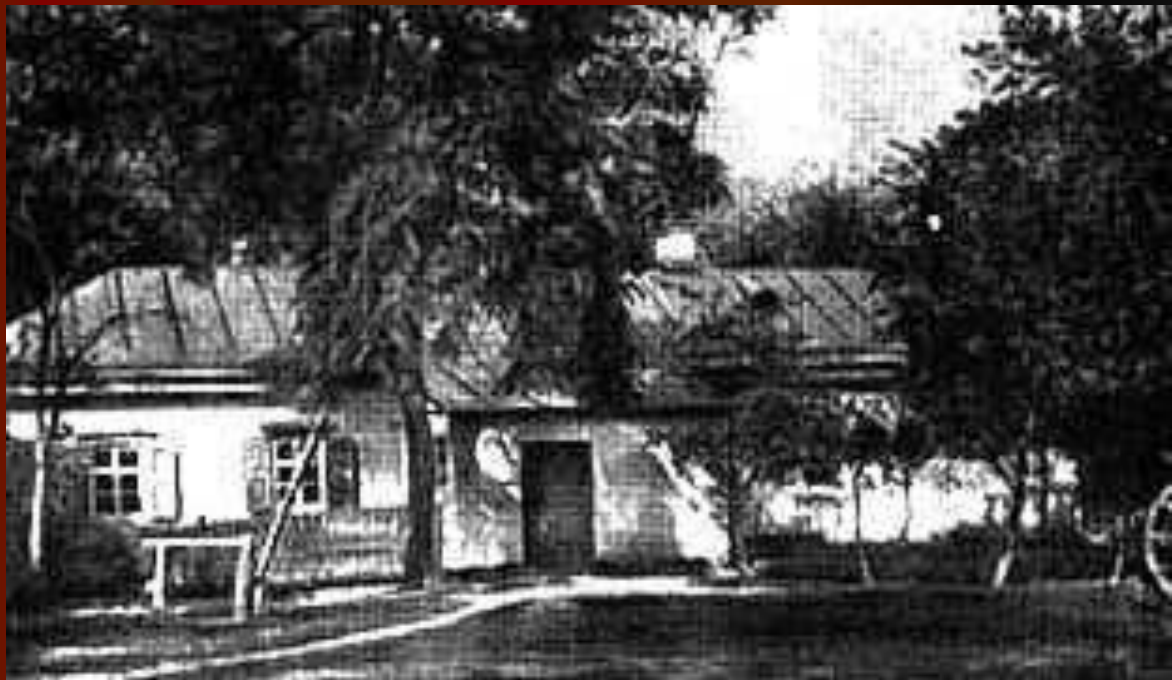
Дом доктора М.Я.Трохимовского в Сорочинцах, где родился Гоголь