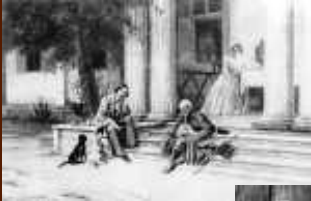
Н.В. Гоголь в Яновщине