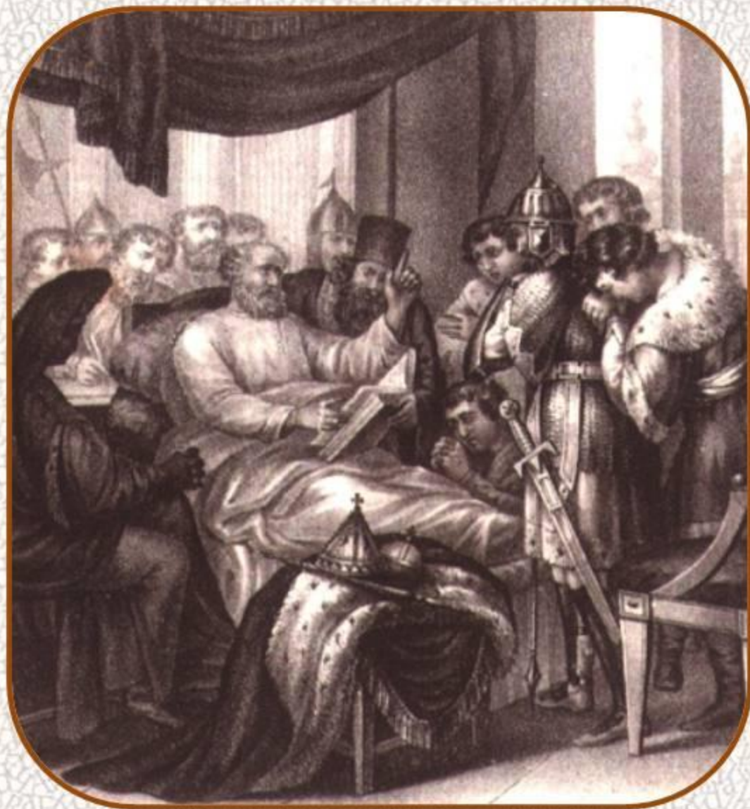
Завещание Владимира Мономаха детям. Литография по рисунку художника Бориса Чорикова. 1836 год

Из «Поучения» мы можем узнать о детстве и юности Владимира, о его верности православной вере, о его любви к церковной службе и молитве, заботе о своих подданных, об отношении к самому себе и другим людям.