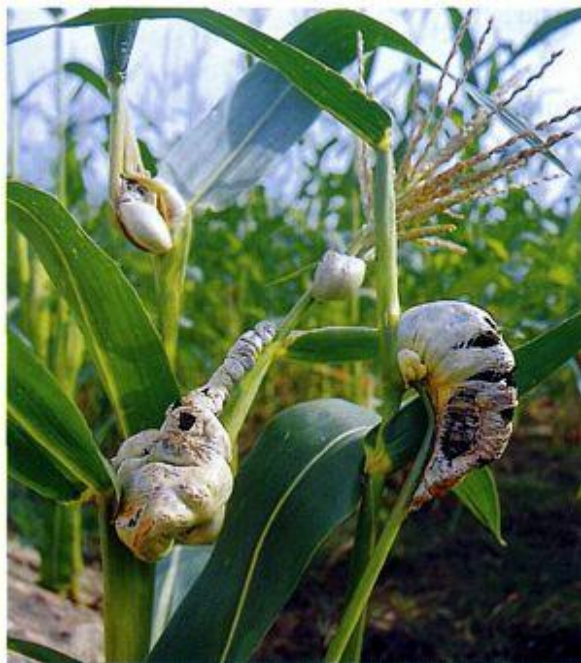
Початки кукурузы, пораженные головневым грибом