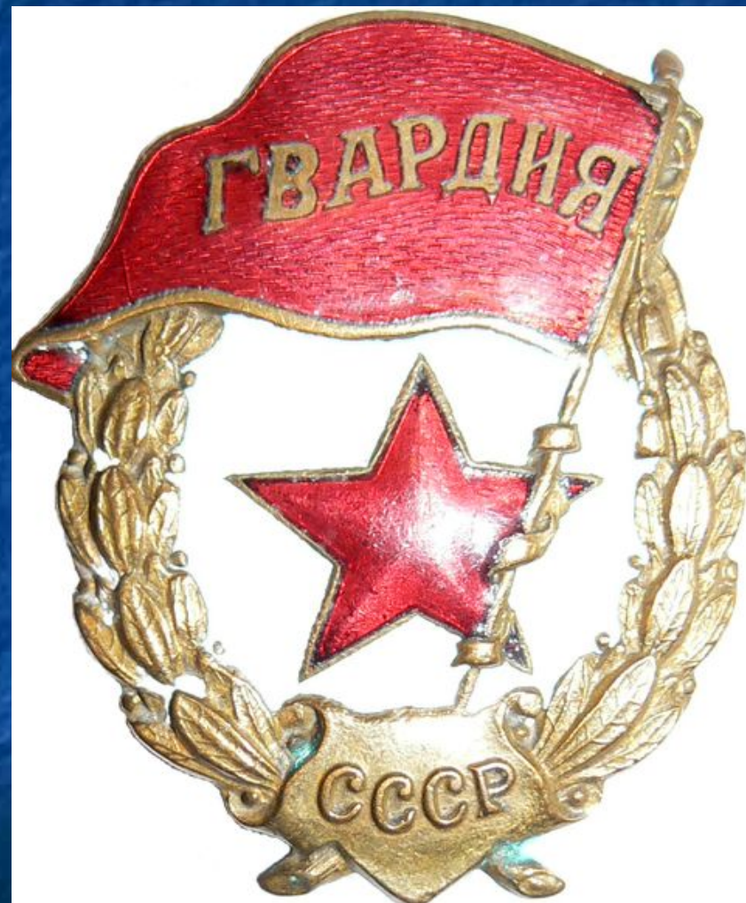
■ Нагрудный знак гвардейца. 1942 г.