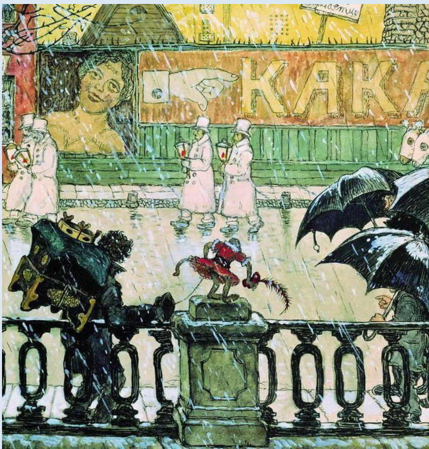
М.В. Добужинский. Grimасы города. 1908 год. Бумага, акварель, гуашь. Третьяковская галерея.