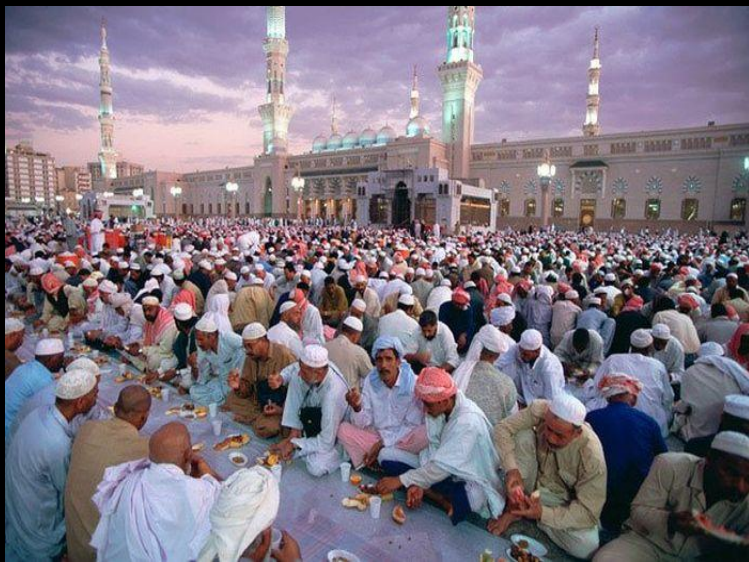
День окончания поста Рамадан