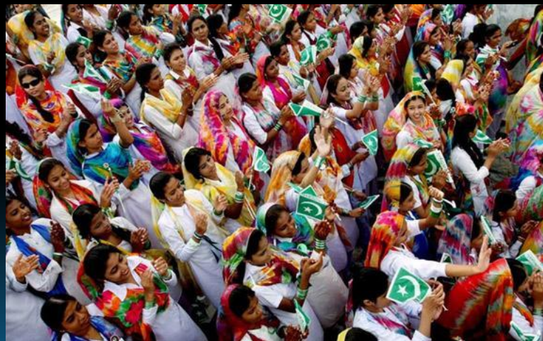
День независимости в Пакистане