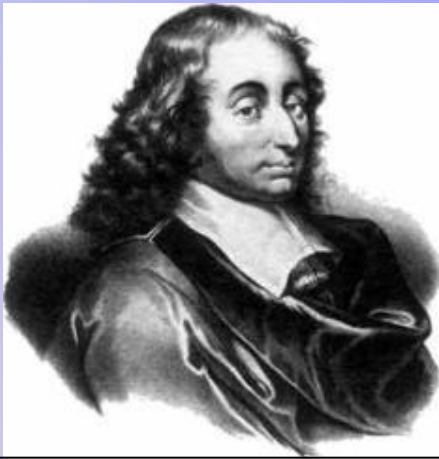
БЛЕЗ ПАСКАЛЬ 1623-62