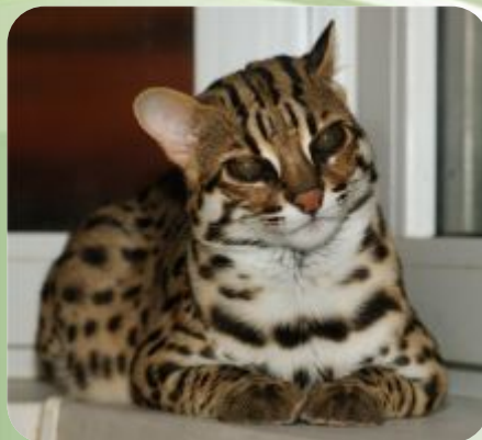
Азиатской леопардовой кошки