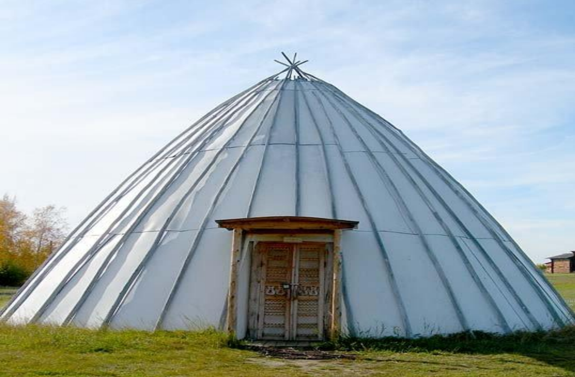
летняя разборная ураса