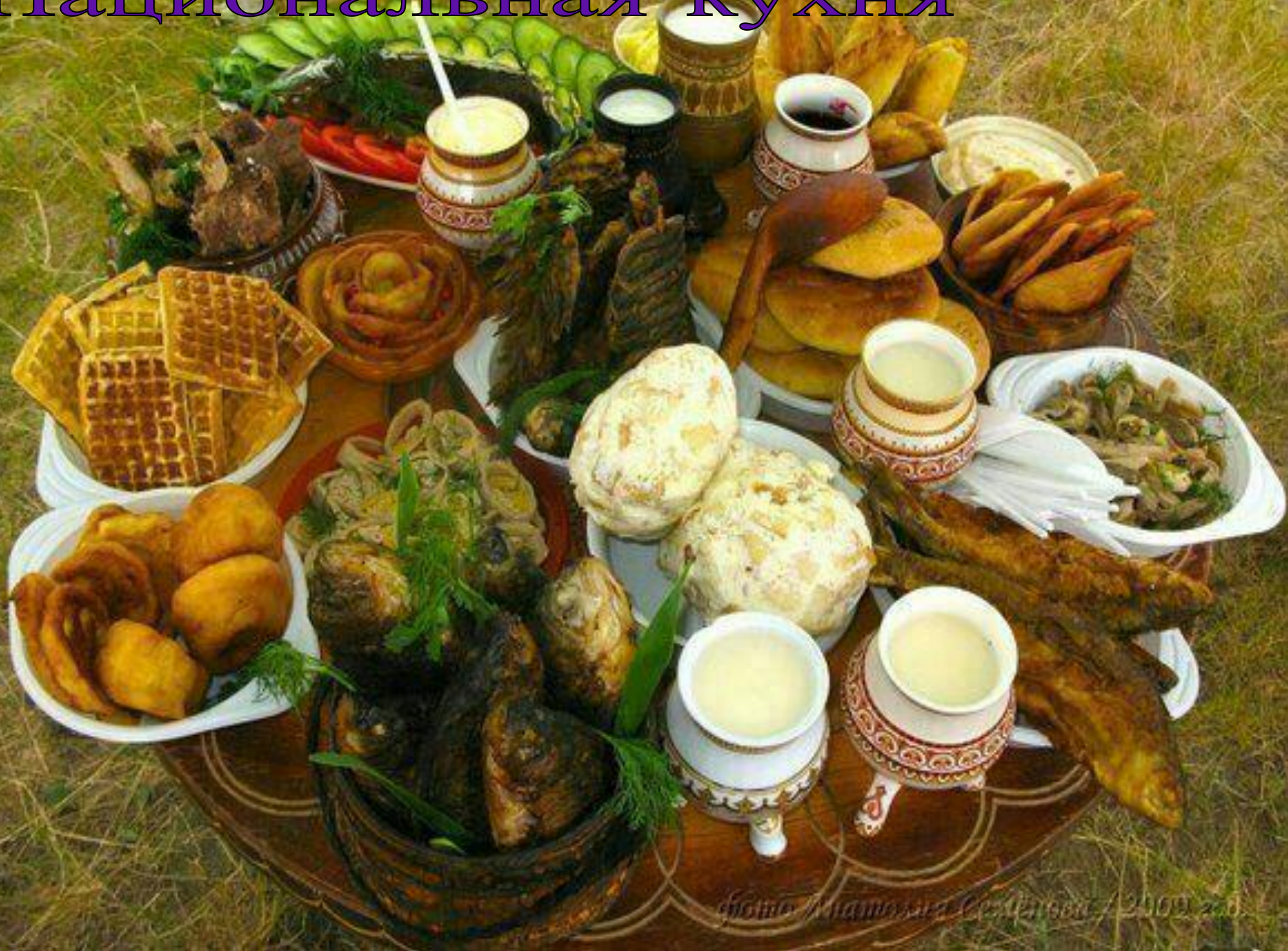
2009 год