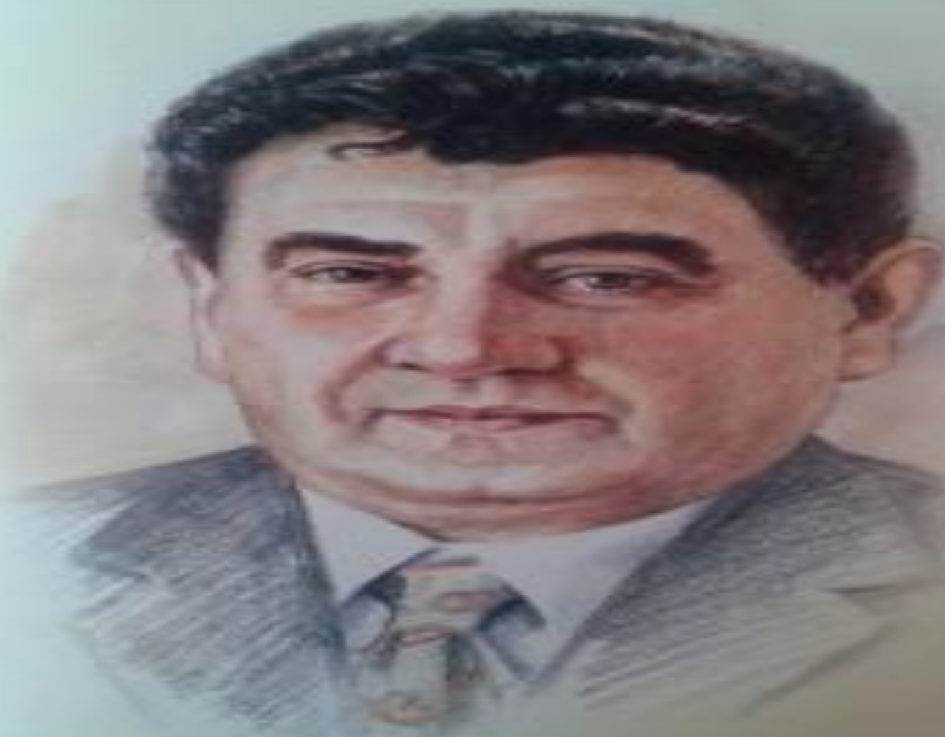
ДРАГУНСКИЙ ВИКТОР ЮЗЕФОВИЧ (1913 — 1972)