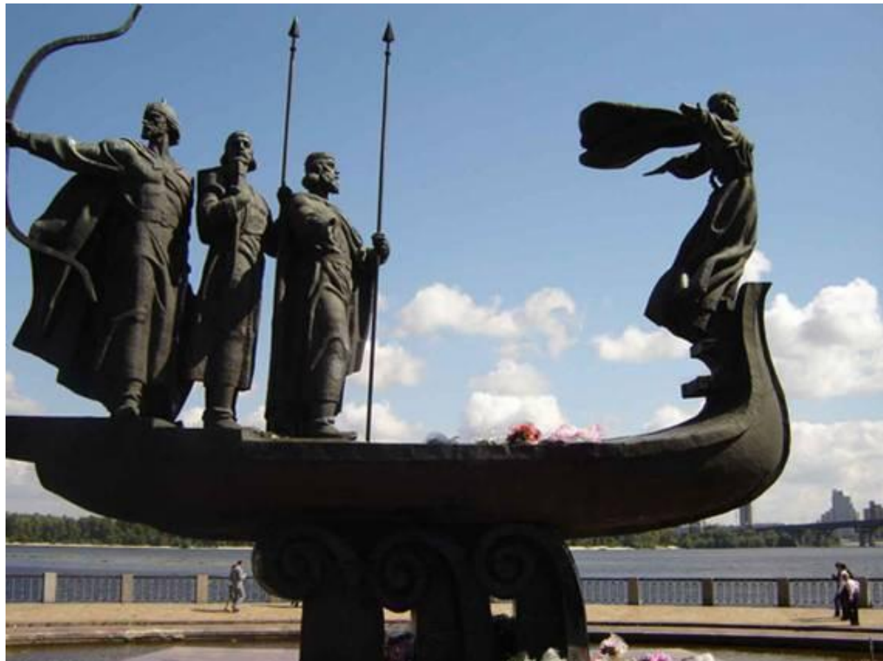
Памятник Киево, Щеку, Хориву и Лыбеди

С тех пор минуло много лет. Пришли на холмы три брата - Кий, Щек и Хорев, и с ними сестра их Лыбедь. Предание говорит, что Кий был перевозчиком через речку Днепр. По его имени называли эту местность Киев перевоз (т.е., другими словами – Перевоз Кия ). А потом так стали называть и город, который вырос на этом месте. Город рос, развивался... а имя его наоборот уменьшилось. Где-то в глубинах истории потерялось слово «перевоз» и осталось только слово «Киев».