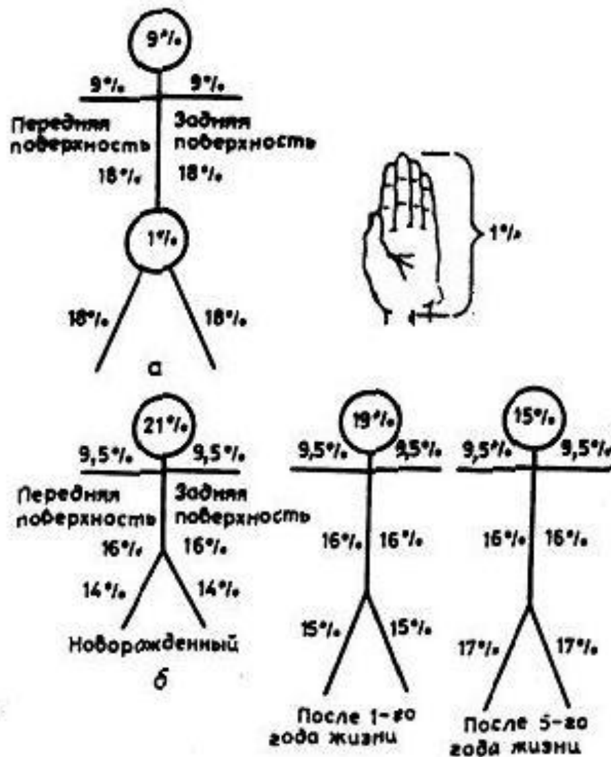
Схема для определения площади ожога (правило девяток), у взрослых(а), у детей(б)