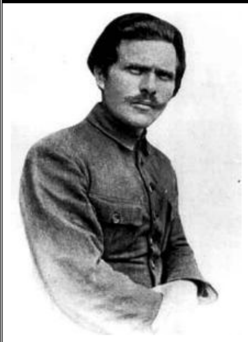
Нестор Махно (1888 -1934 г.г.)

Украина – отряды «батьки Махно» Н.И. Махно – в юности увлёкся идеями анархизма, после революции в Гуляй-Поле (Украина) крестьяне под его руководством провели «чёрный передел» земли. После оккупации Украины германскими войсками возглавил партизанскую борьбу за независимую Украину. Они сражались под чёрными знамёнами с надписями «Свобода или смерть!» Против белогвардейцев махновцы выступали вместе с Красной армией. Но сперва в июне 1919 г., а затем в 1920г. командование Красной армии ведёт борьбу с махновщиной.