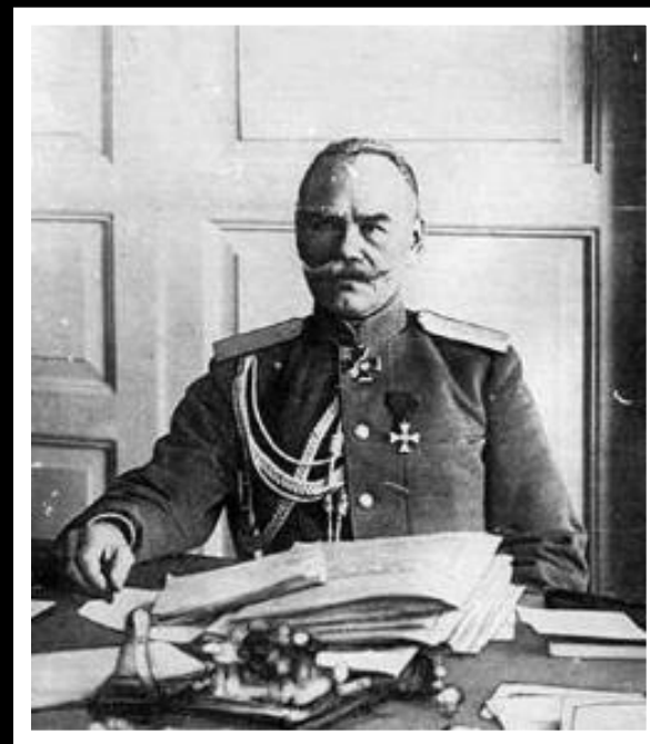
Верховный руководитель Добровольческой армии А.В.Алексеев

Дальний Восток: высадка американских и японских войск.