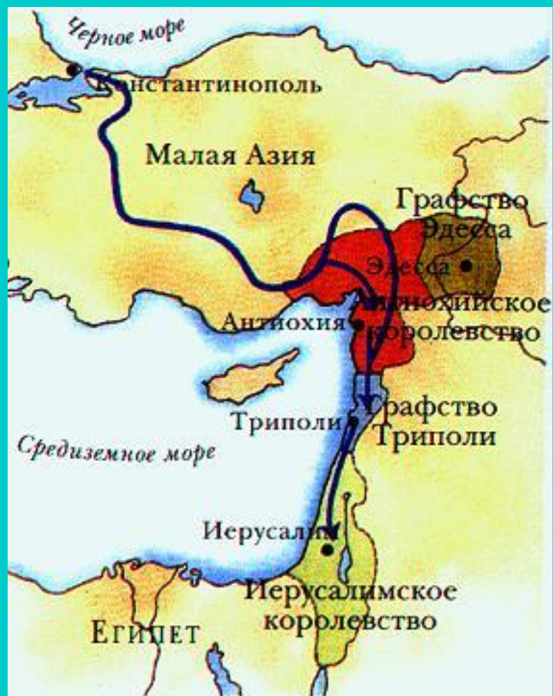
Государства крестоносцев в Малой Азии.

Со временем владения крестоносцев в Палестине уменьшались. С развитием хозяйства рыцарям стало выгоднее заниматься поместьем, чем воевать.