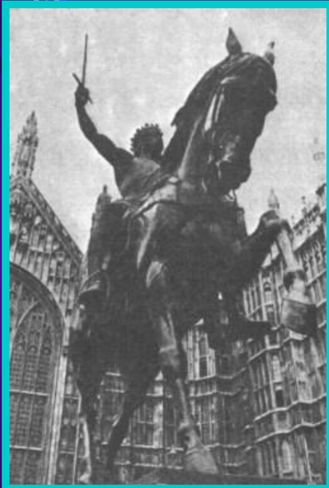
Памятник Ричарду Львиное Сердце у английского парламента.

По приказу Ричарда англичане перебили в Акре 2 тысячи мусульман.