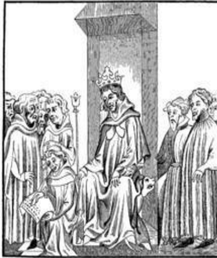
Fig. 7.—The King of the Franks, in the midst of the Military Chiefs who formed his Troisac , or armed Court, dictates the Salic Law (Code of the Barbaric Laws).—Fac-simile of a Miniature in the "Chronicles of St. Denis," a Manuscript of the Fourteenth Century (Library of the Arsenal).