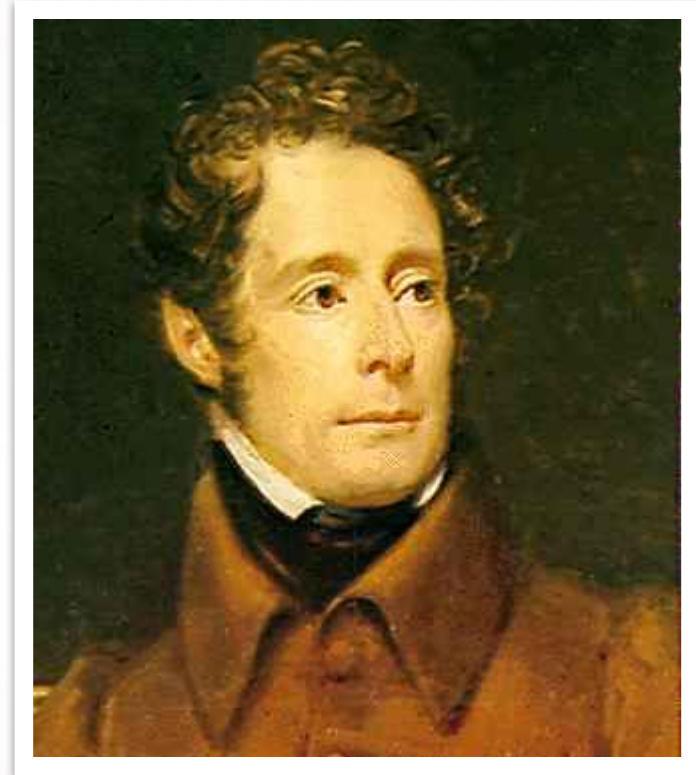
Альфонс Ламартин — глава правительства