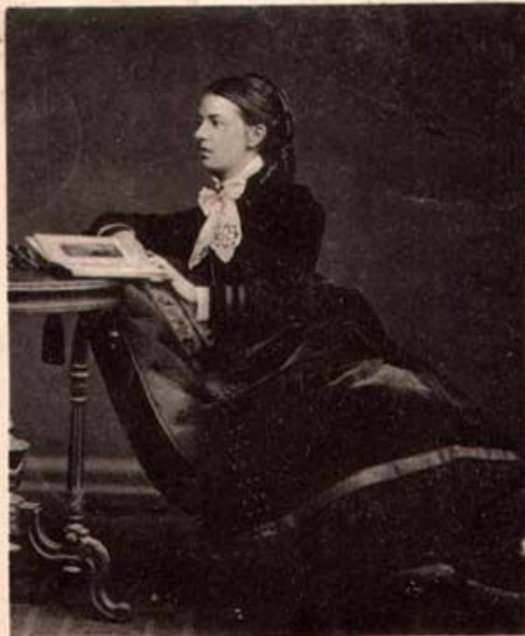
София Васильевна Ковалевская, урожд. Корвинь-Круковская, 1850—1891.

Доктор философии Геттингенского университета, проф. математики Стокгольмского университета.