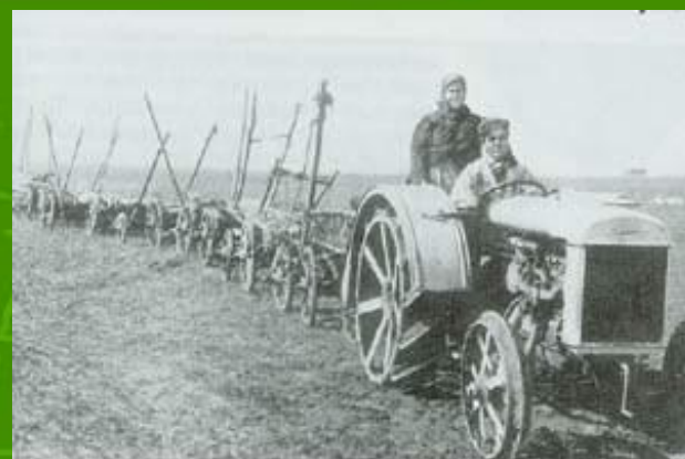
Новая техника на колхозных полях.