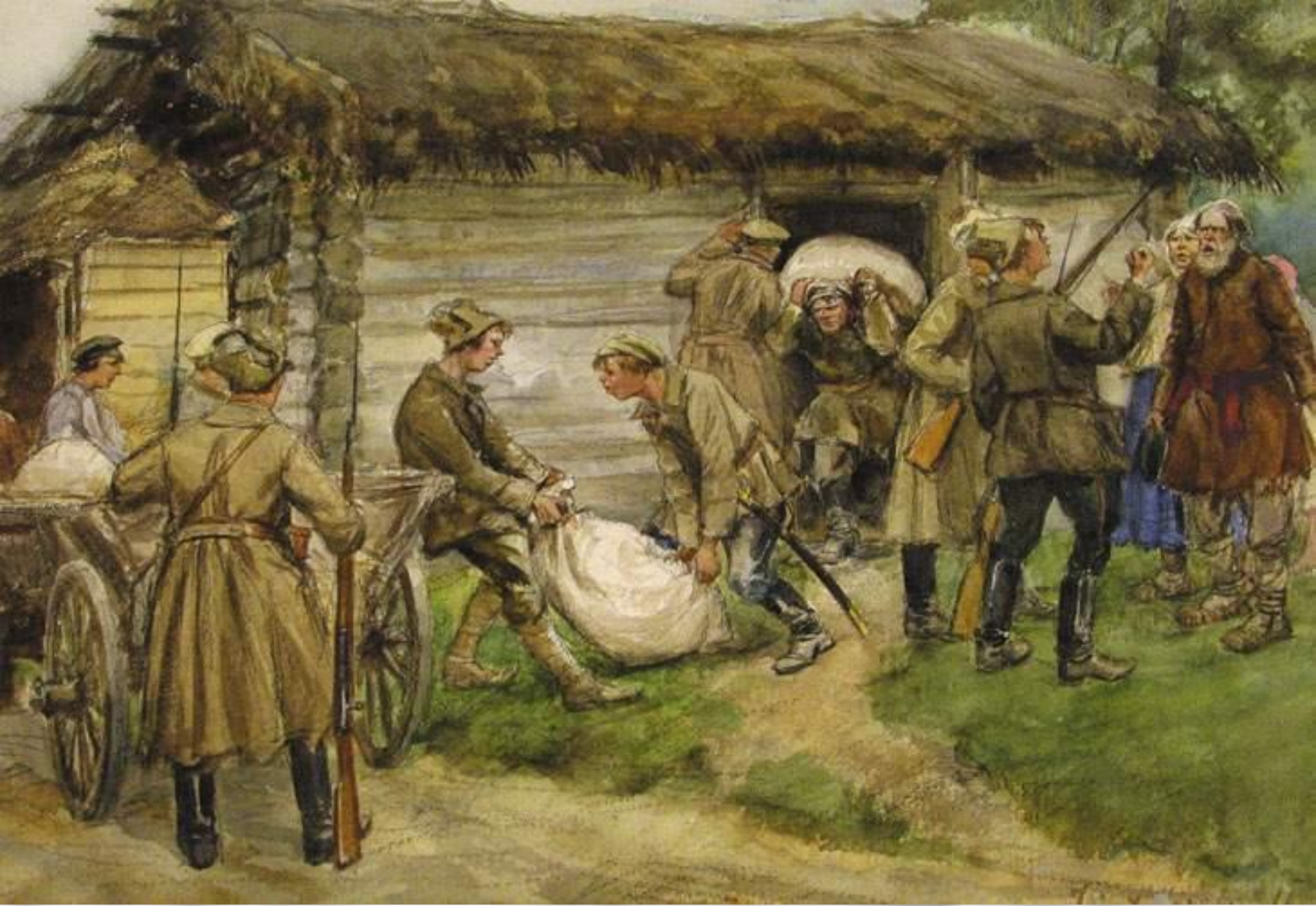
Семья «кулака» на выселение.