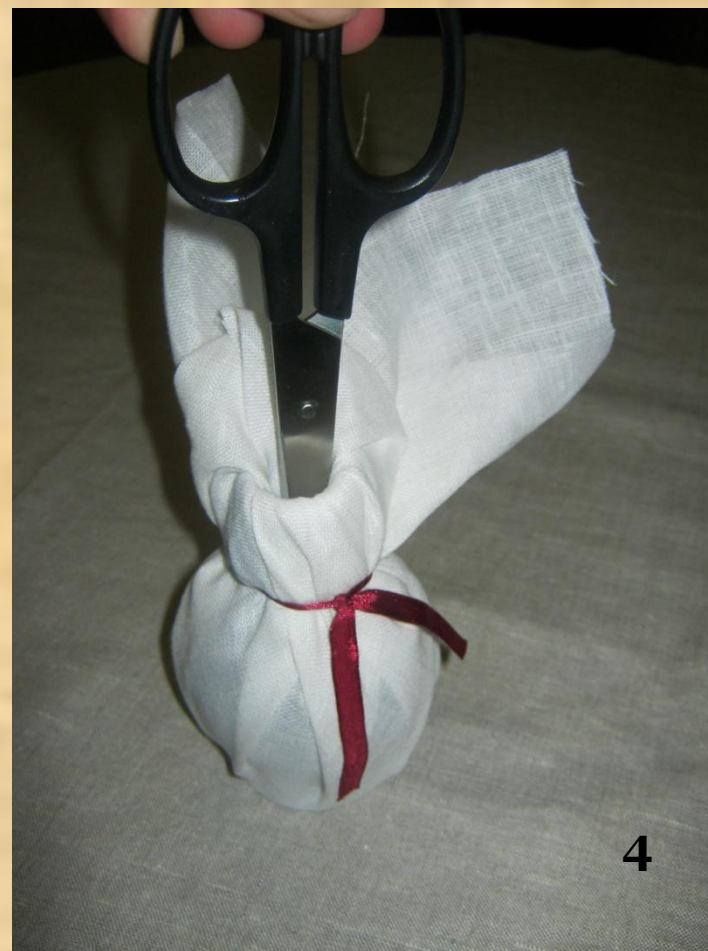
Края ткани заправляем в горлышко бутылки ножницами