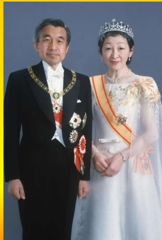
Акихито и его супруга