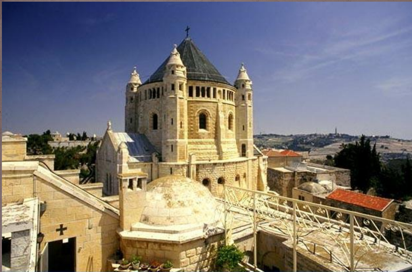
Старый Иерусалим. Успенский монастырь.