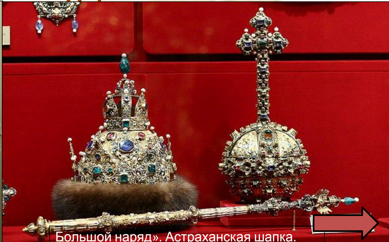
Большой наряд». Астраханская шапка. 1637 г.