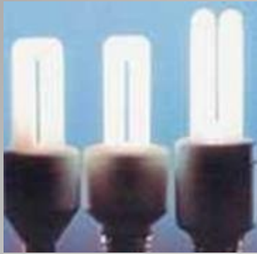
Светильники с разрядными лампами