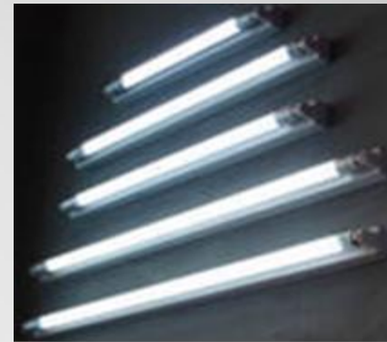
Лампа дневного света