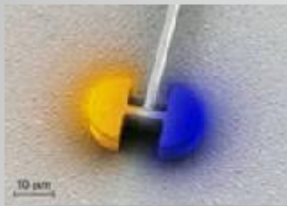
Резонансный контур лазера с двумя полукруглыми лазерами