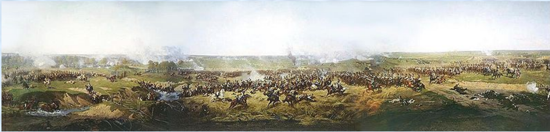
Атака русских кирасир под Бородиным. Фрагмент панорамы Бородинского сражения. Рубо (1912)