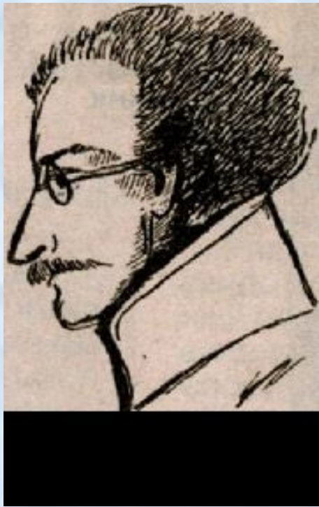
А.Н.Чеченский Рисунок А.С.Пушкина, 1829г.

Во всех партизанских вылазках проявляется храбрость Чеченского. 28 сентября 1812 года при освобождении села Ляхово русские воины под командованием Александра Чеченского взяли в плен 2 тысячи рядовых, 60 офицеров и одного генерала. За взятие Гродно без кровопролития Чеченскому был присвоен чин майора. В начале 1813 года Чеченский осадил Дрезден. Город сдался ему без боя. Давыдов доносил в своем рапорте: «...Чеченский отличился, это его привычка». А потом были сражения за Рейхенбаум, Бауцен, Люцин, Оснабрюк, Делич, Толх... Полк Чеченского участвовал в исторической «битве народов» под Лейпцигом. За сражение под Лионом с 70 тысячной армией Наполеона Александр Чеченский был награжден орденом Святой Анны с бриллиантами. После взятия Парижа полковник Чеченский в свите царя участвует в торжественном параде на Елисейских полях. Грудь полковника украшали серебряные медали «За вступление в Париж» и «В память 1812 года».