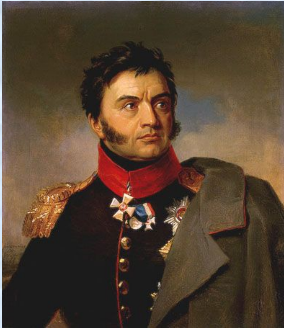
Николай Николаевич Раевский