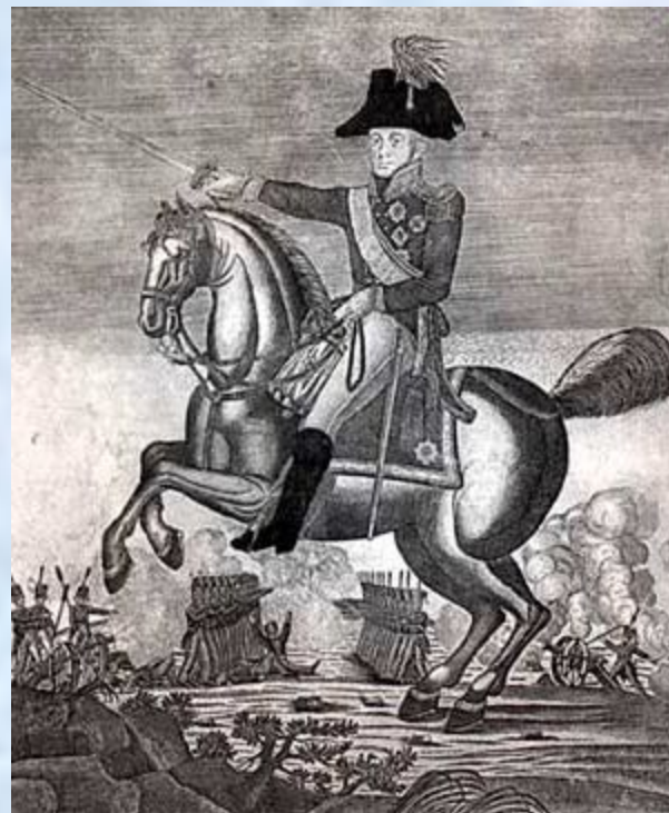
Барклай де Толли Михаил Богданович. Гравюра неизвестного автора. 1810-е гг.