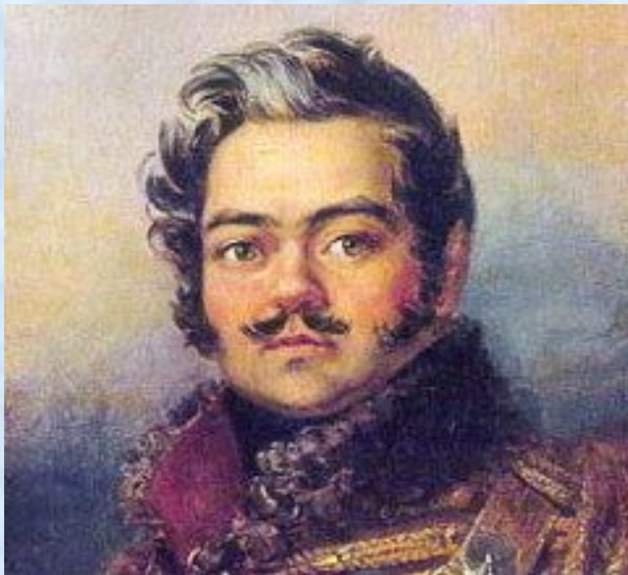
Поэт «Пушкинской плеяды», генерал-лейтенант, партизан Портрет Дениса Васильевича Давыдова мастерской Джорджа Доу. Военная галерея Зимнего Дворца, Государственный Эрмитаж (Санкт-Петербург)

A handwritten signature of Denis Vasильevich Davydov in cursive script, written in dark ink on a light-colored background.