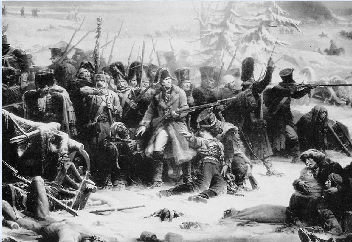
Французские солдаты маршала Нея загнаны в лес в сражении под Красным, худ. А. Ивон

Армейские партизанские отряды создавались преимущественно из казачьих войск и были неодинаковыми по своей численности: от 50 до 500 человек. Им ставились задачи смелыми и внезапными действиями в тылу противника уничтожать его живую силу, наносить удары по гарнизонам, подходящим резервам, выводить из строя транспорт, лишать врага возможности добывать себе продовольствие и фураж, следить за передвижением войск и доносить об этом в Главный штаб русской армии. Командирам партизанских отрядов указывалось основное направление действий и сообщались районы действий соседних отрядов на случай проведения совместных операций.