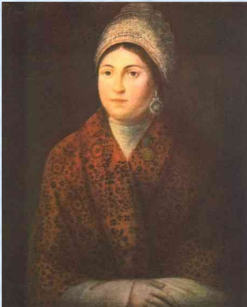
А. Смирнов. «Портрет Василисы Кожиной» (1813)