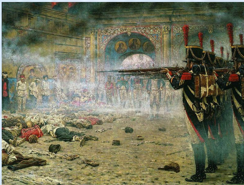
Расстрел предполагаемых поджигателей Москвы французами. Верещагин (1898)

В Отечественную войну она участвовала в сражениях под Смоленском, Колоцким монастырем, при Бородине, где была контужена в ногу, и уехала для лечения в Сарапул. В мае 1813 г. она снова появилась в действующей армии и приняла участие в войне за освобождение Германии, отличившись при блокаде крепости Модлина и города Гамбурга. Только в 1816 г., уступая просьбам отца, она вышла в отставку с чином штаб-ротмистра и пенсионом и жила то в Сарапуле, то в Елабуге. В 1836г. Дурова издала свою автобиографию под заглавием "Записки кавалерист-девицы", при посредстве и поддержке Пушкина, напечатавшего отрывки из этих записок в своем "Современнике" и рекомендовавшего их публике. Скончалась в 1866 г.