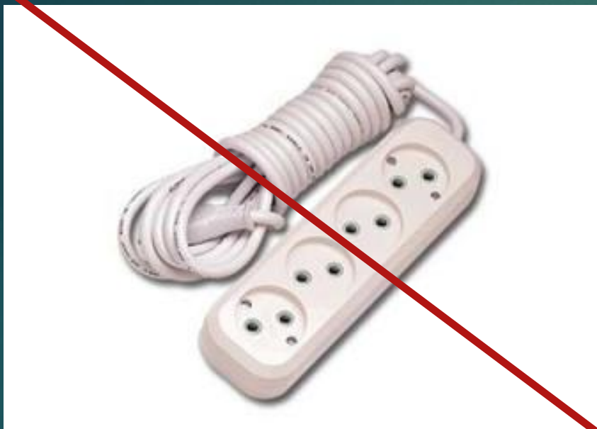
Удлинитель без контакта заземления