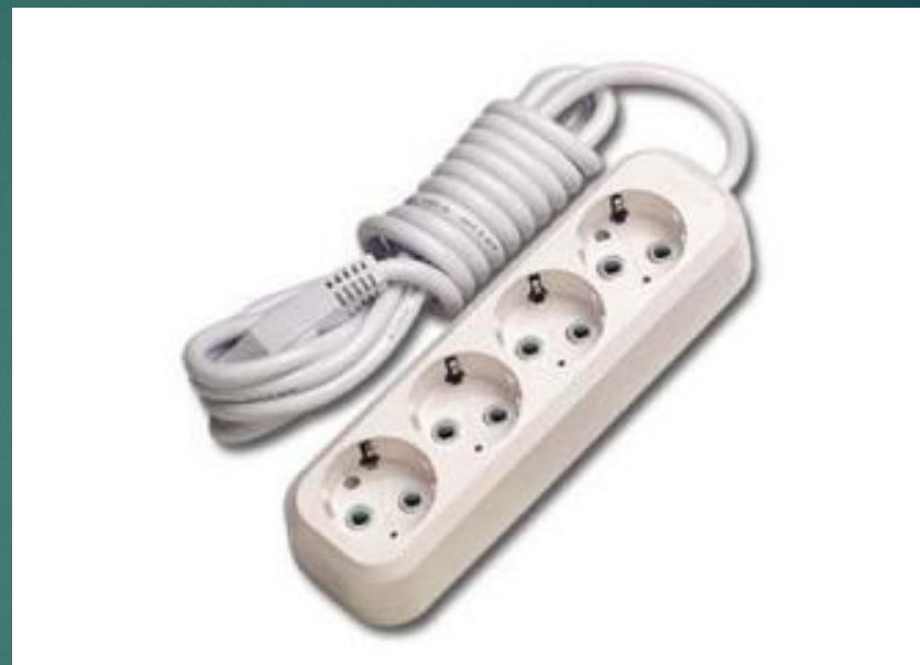
Удлинитель с контактом заземления