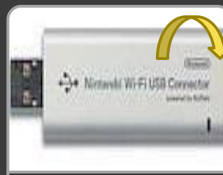
Nintendo Wi-Fi USB Connector