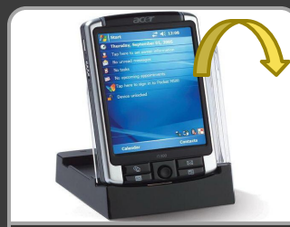
КПК Acer n300