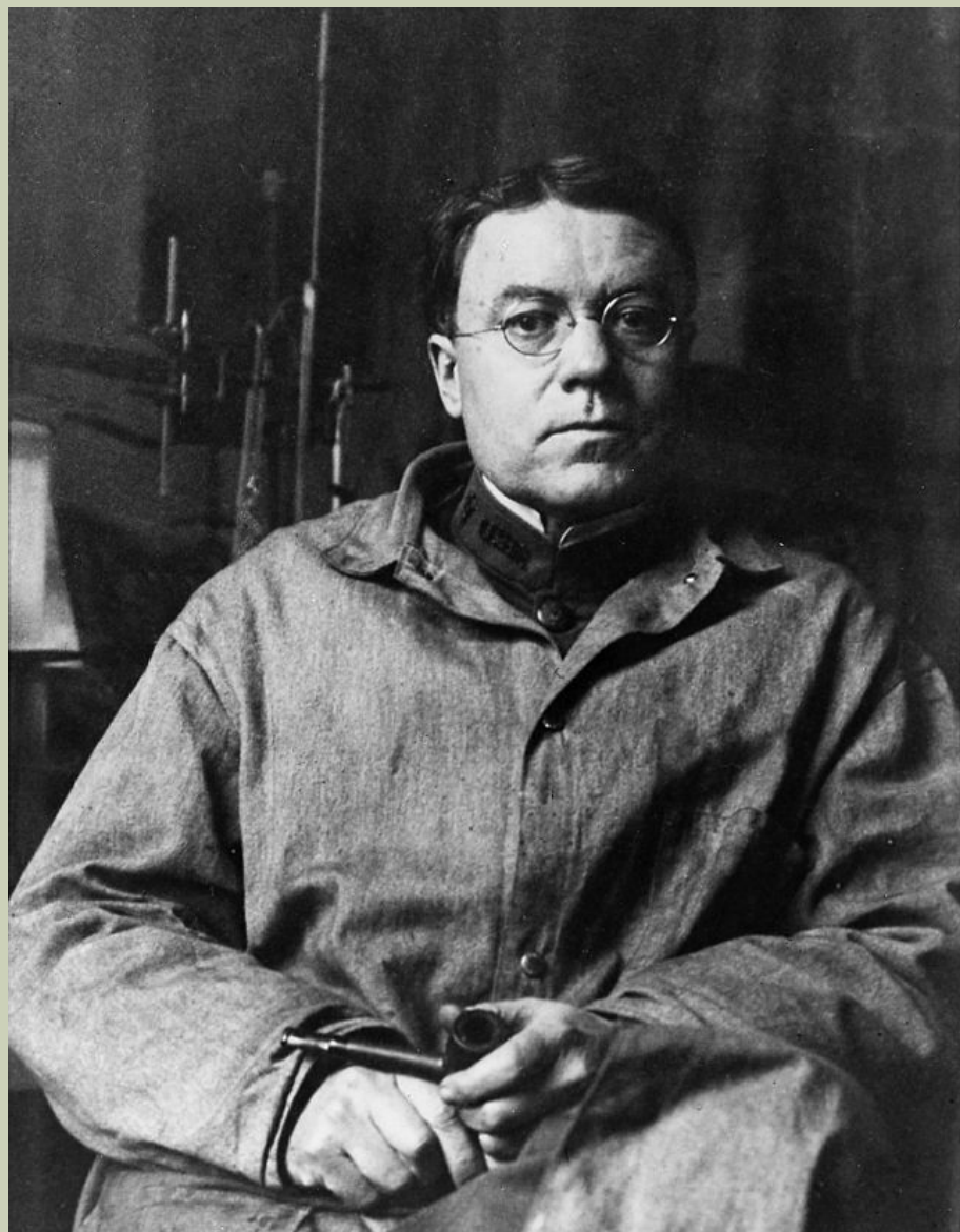
Уолтер Бредфорд Кеннон

Термін «стрес» у фізіологію та психологію вперше ввів у 1932 році Уолтер Бредфорд Кеннон .