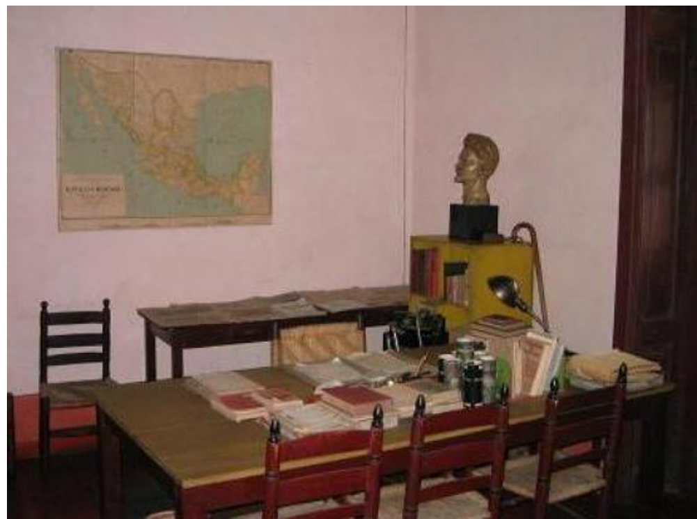
Троцький в творчості