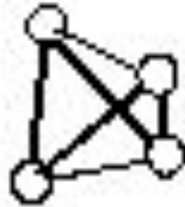
Белый фосфор (P 4 )