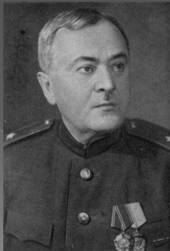
Александр Васильевич Александров