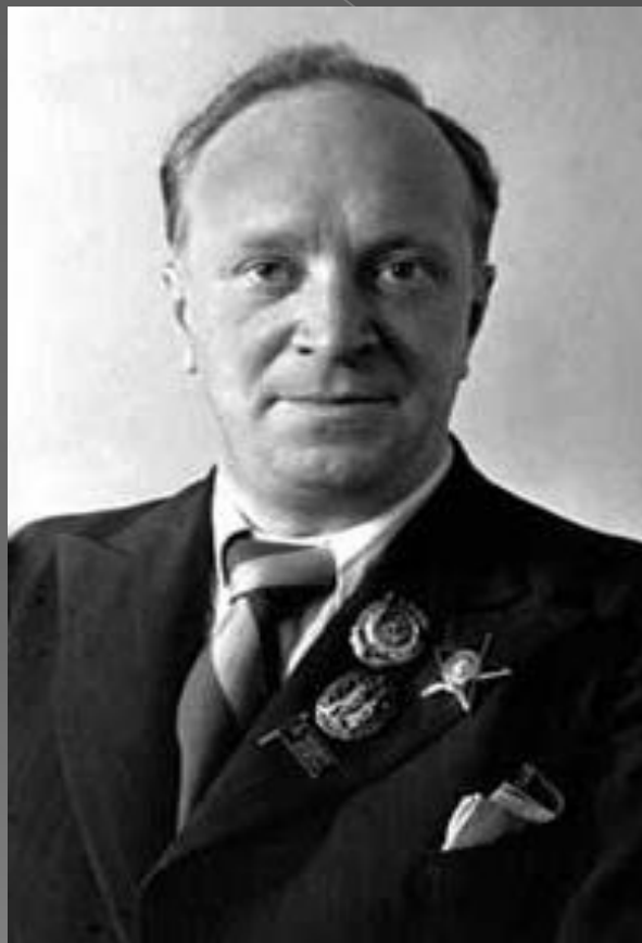
Василий Иванович Лебедев-Кумач