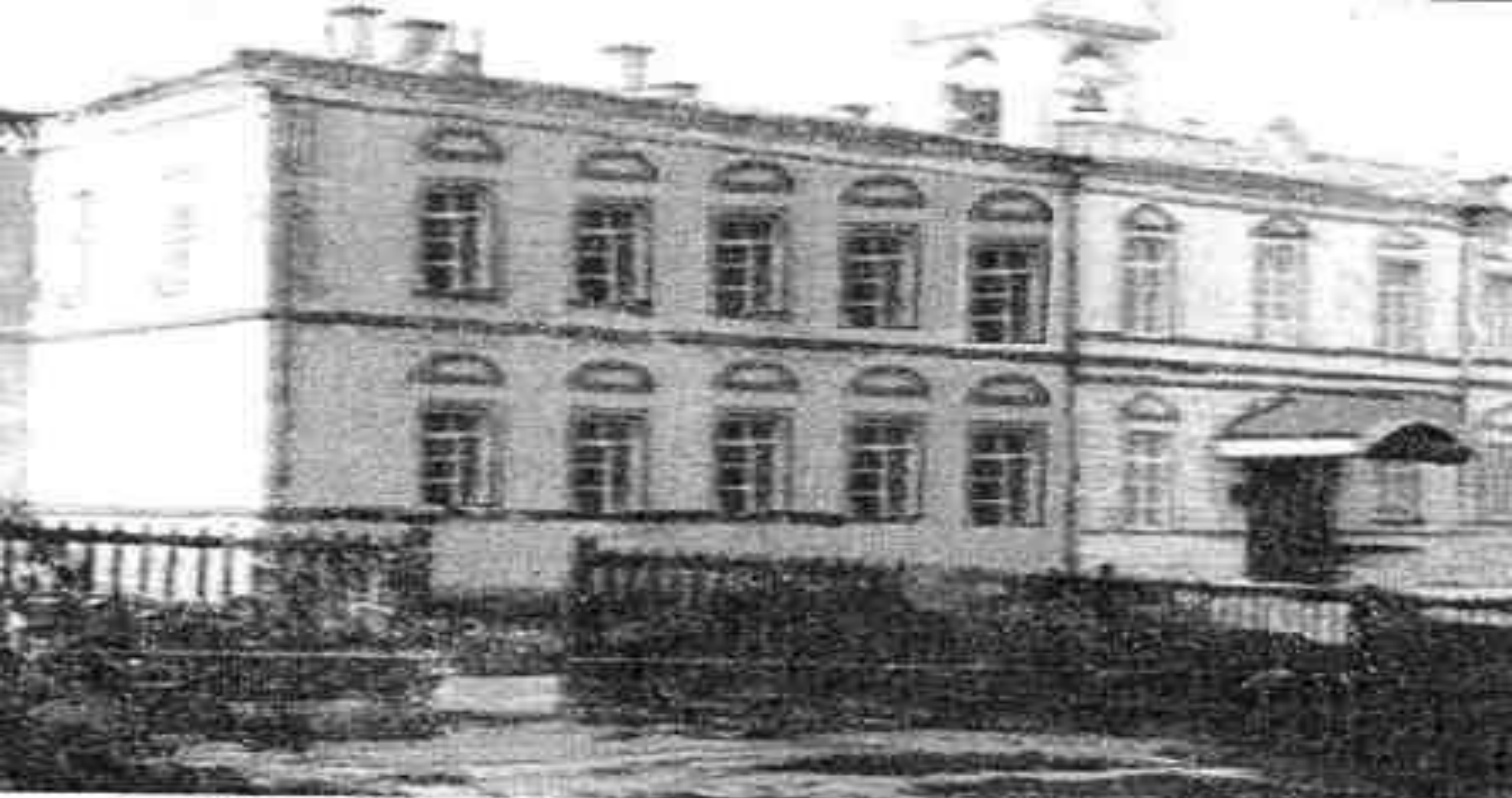
Здание земской больницы. Фото начала XX века.