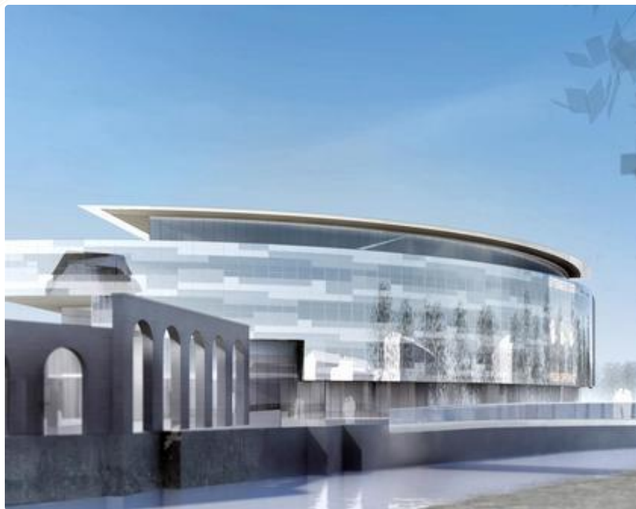
Школа № 4 в 2090 году.

Так будет реконструирована наша школа к 2090 году. Фасад здания выполнен из высококачественных материалов, которые прослужат многие столетия. Также здание является безопаснейшим сооружением и готово выдержать даже нашествие инопланетян.