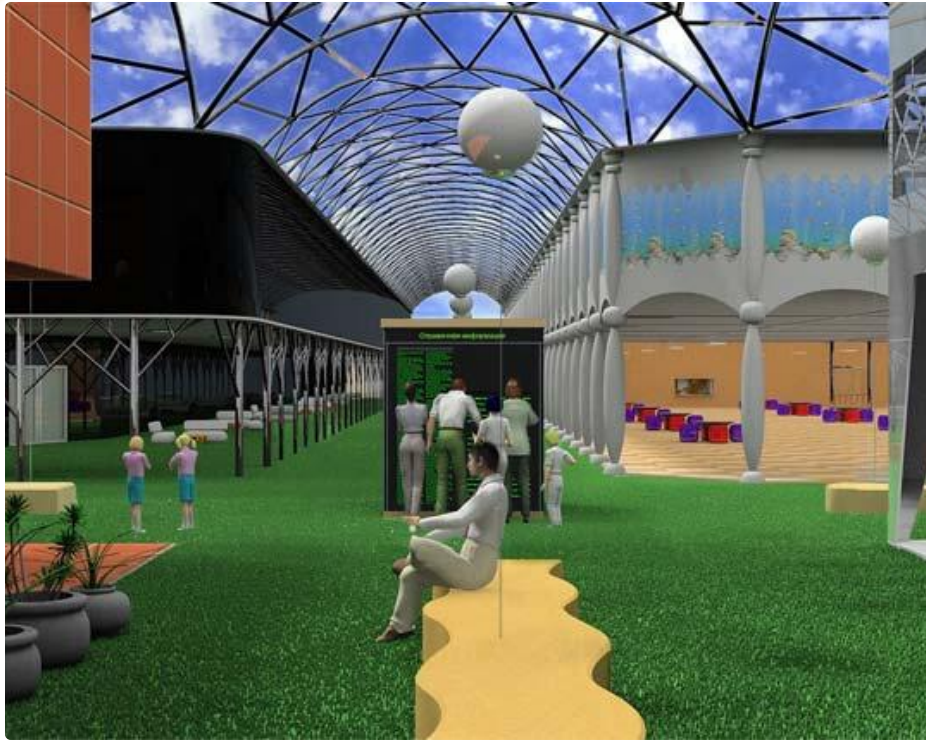
Внутренний дворик .

Главная особенность школы будущего – это полная компьютеризация. Даже расписание будет интерактивным ,причем ученик сам составляет его из набора обязательных предметов и предметов по выбору. Также ученик сам выбирает количество и длительность перерывов между уроками.