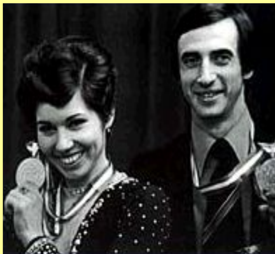
Людмила Пахомова и Александр Горшков — первые олимпийские чемпионы в спортивных танцах на льду. Калгари. (1988).