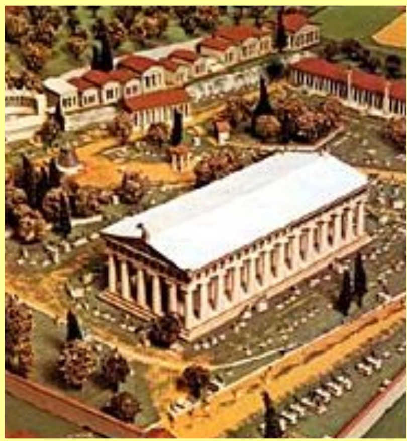
Храм Зевса в Олимпии

По мифологическому преданию, Олимпийским играм предшествовали погребальные игры в честь героя Пелопса , впоследствии возобновленные Гераклом. Пелопс и Геракл считались также учредителями первых видов состязаний: скачек на колесницах, бега и борьбы. В 4 в. до н. э. на основании реконструкции списков победителей была условно определена дата первых Игр — 776 до н. э. Установление порядка их проведения приписывалось в древности царю Элиды Ифиту, спартанскому законодателю Ликургу и ахейцу из Писы Клеосфену, заключившим (с одобрения дельфийского оракула) священный союз. Текст договора о правилах состязания был записан на бронзовом диске, о нем в 4 веке до н. э. сообщает Аристотель, во в 2 веке в храме Геры его еще видел Павсаний .