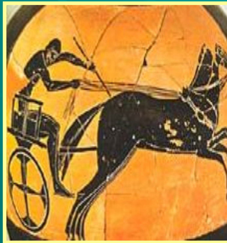
Алене – скачки на колесницах, запряженных двумя мулами