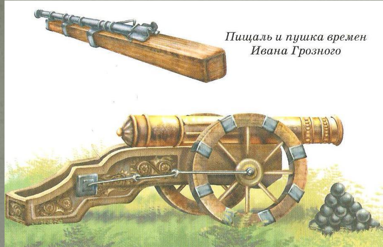
Пищаль и пушка времен Ивана Грозного