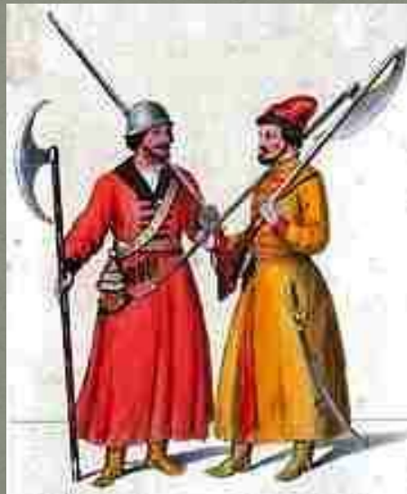
Стрельцы в России составили первое постоянное пешее войско.