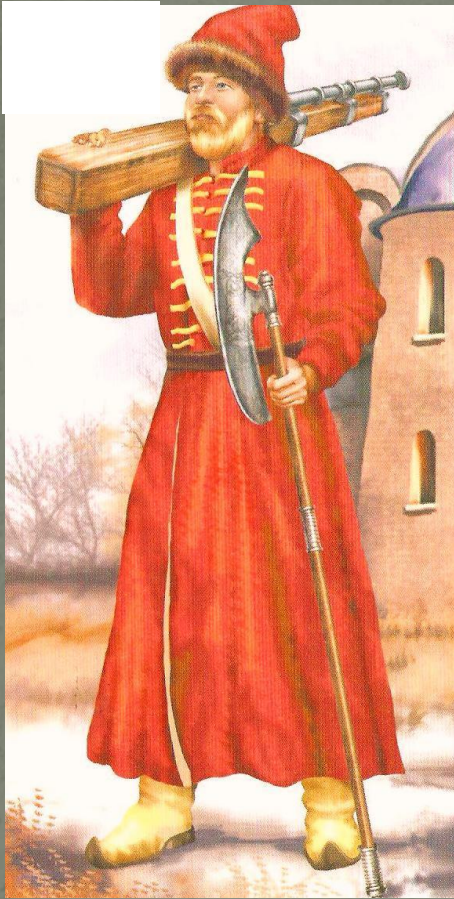
Стрелец — служилый человек