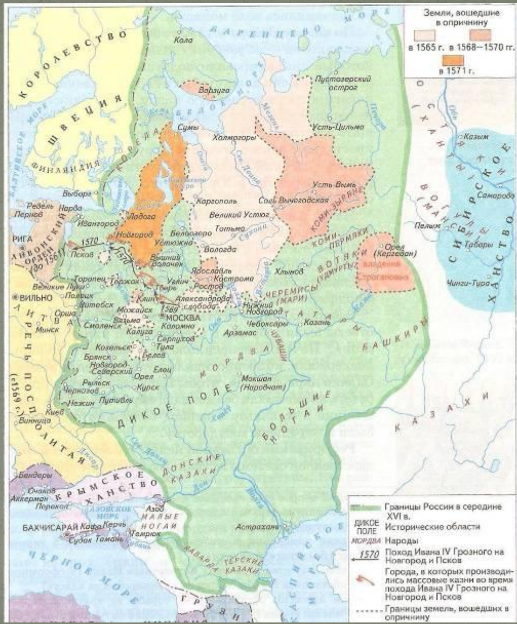
Россия при Иване IV