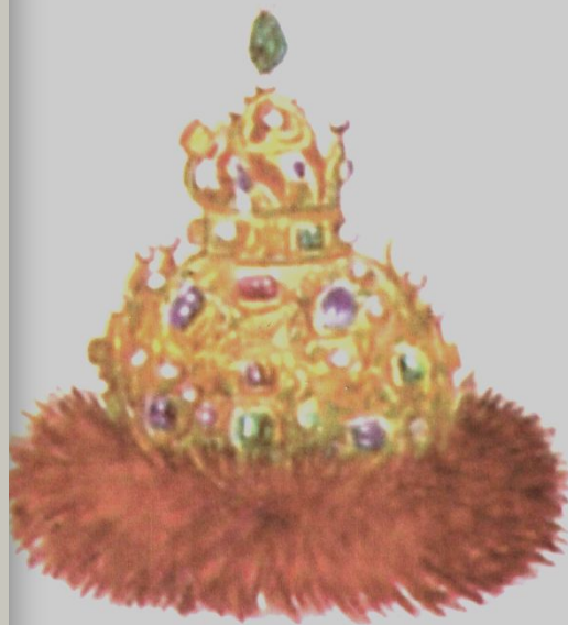
Венец (шапка Мономаха)