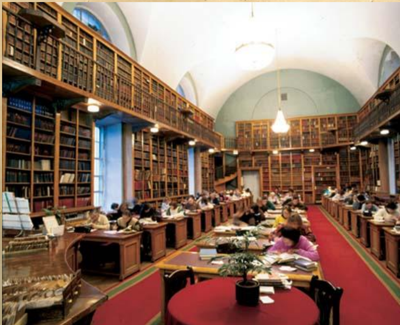
Читальный зал литературы и искусства.

В библиотеке есть книги на разных языках народов мира. Каждый день в её читальные залы приходят около 5 000 читателей.