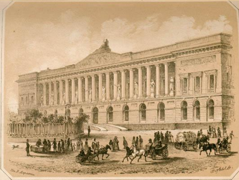
Корпус К. И. Росси. По рисунку П. Ф. Бореля. 1852

Росси украсил главный фасад библиотеки белой колоннадой. Она расположена на уровне второго этажа.