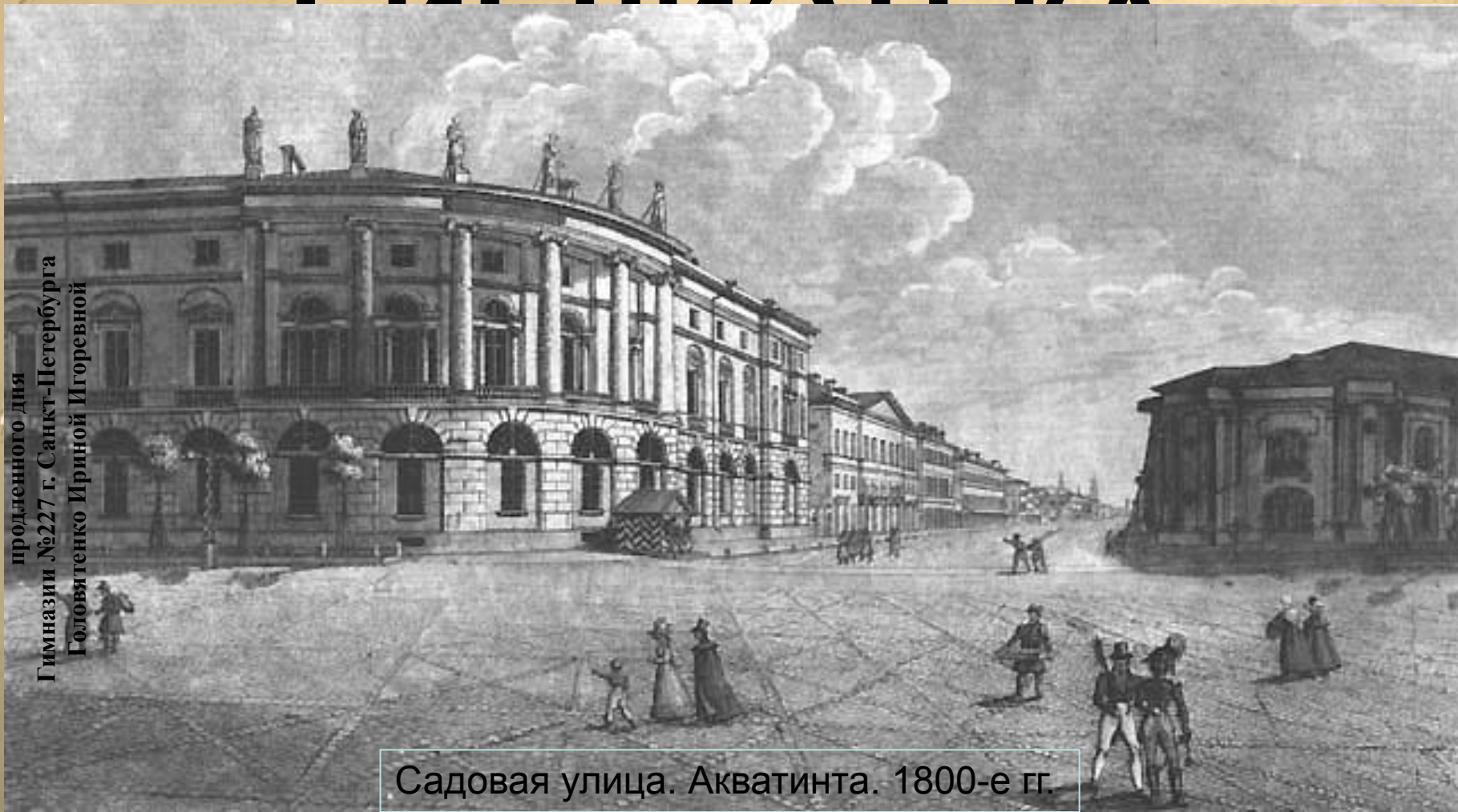
Садовая улица. Акваинта. 1800-е гг.

Презентация выполнена воспитателем группы продленного дня