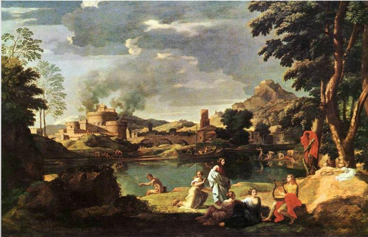
Пейзаж с Орфеем и Эвридикой

Рационалистический принцип полностью торжествует в его искусстве. Строгая организованность и рассудочность композиций, подчиненных простейшим геометрическим формам, граничат с ясностью математического расчета. Пространство четко делится на планы, причем в построении композиций Пуссен обычно использует приемы римских рельефов; главное действие разворачивается на сравнительно неглубокой площадке переднего плана, все строится на точно продуманном ритме рассчитанных, уравновешенных движений.