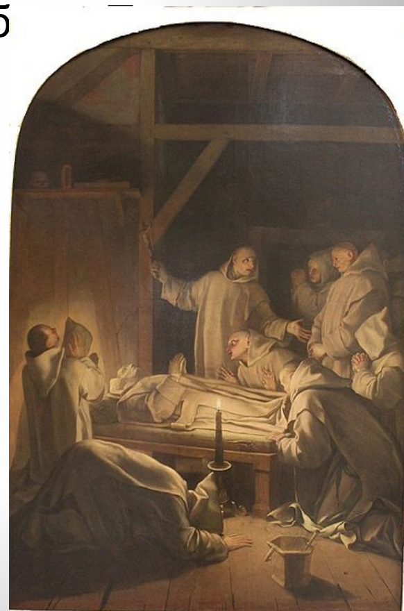
«Смерть св. Бруно» Лувр