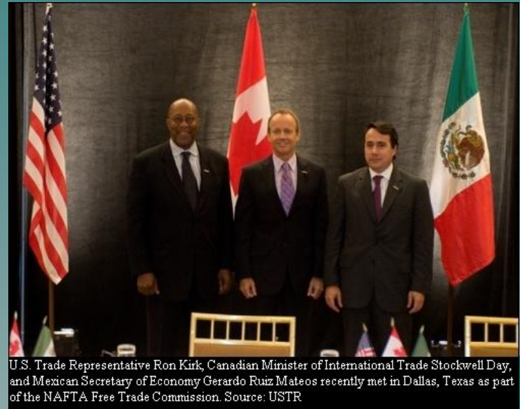
U.S. Trade Representative Ron Kirk, Canadian Minister of International Trade Stockwell Day, and Mexican Secretary of Economy Gerardo Ruiz Mateos recently met in Dallas, Texas as part of the NAFTA Free Trade Commission.