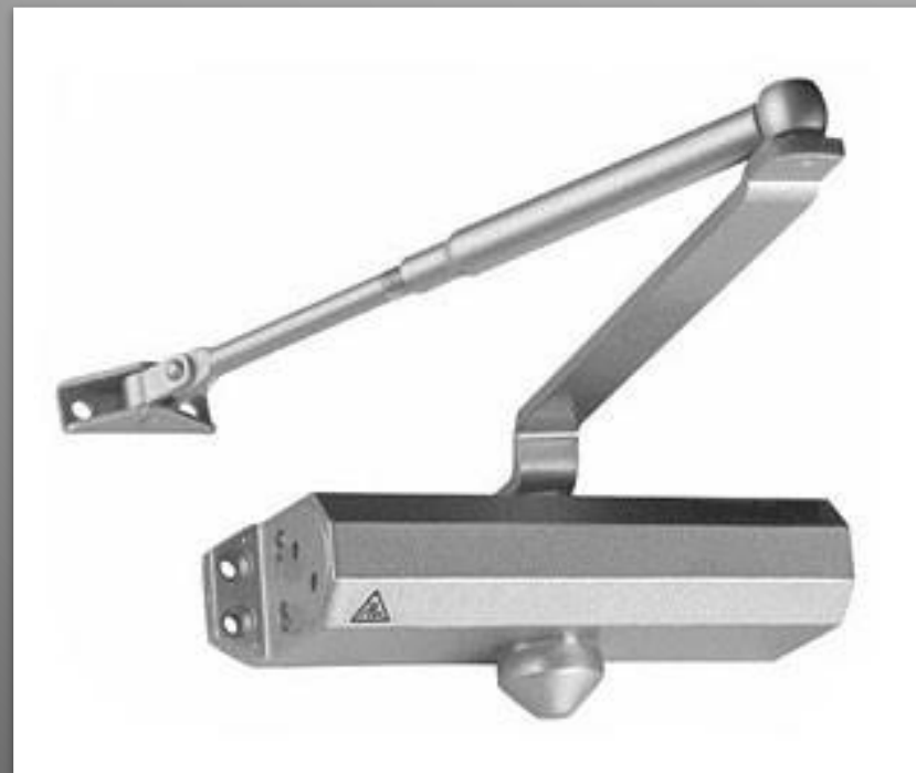
Дверной доводчик, в основу работы которого положена пружина, помещенная в металлический корпус, заполненный специальным маслом.