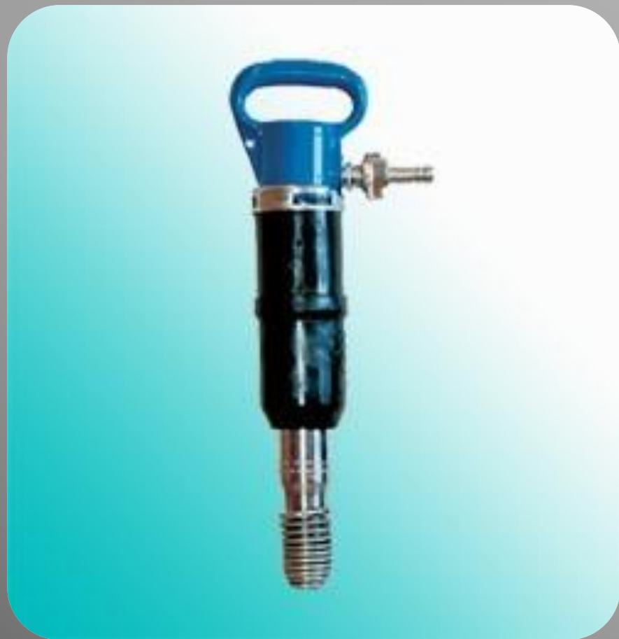
Отбойный пневматический молоток ТЭМЗ (Томский электромеханический завод)

Чем сильнее сжат газ, тем большей потенциальной энергией он обладает и тем большую работу может совершить сила упругости.