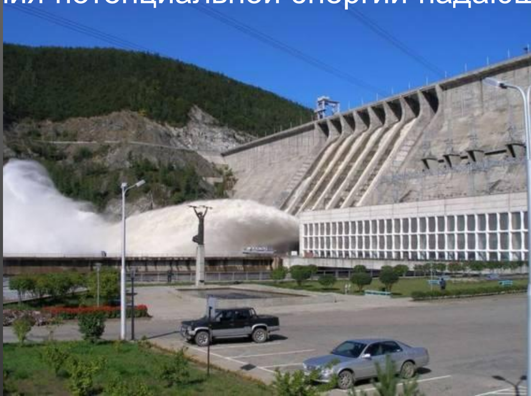
Плотина Зейской ГЭС (Амурская область) высотой 115,5 м

Механическая работа совершается за счёт изменения потенциальной энергии падающей воды.