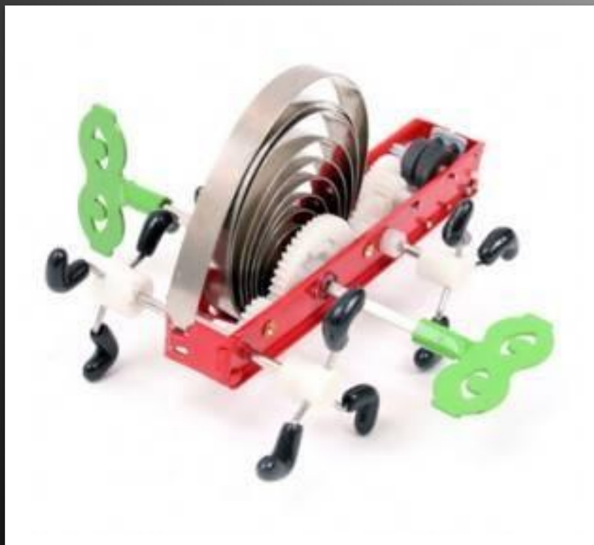
Заводная игрушка «Механические ножки»

Потенциальной энергией обладают также деформированные пружины, используемые в разнообразных заводных игрушках, а также для закрытия входных дверей. Чем больше деформирована пружина, тем большей потенциальной энергией она обладает.