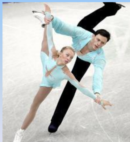
Татьяна Тотмянина и Никита Малинин