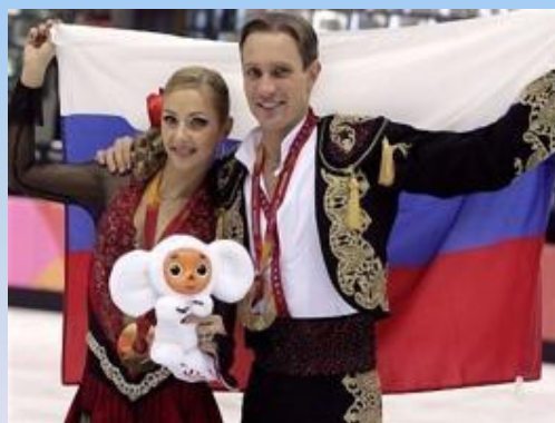
Татьяна Навка и Роман Костомаров