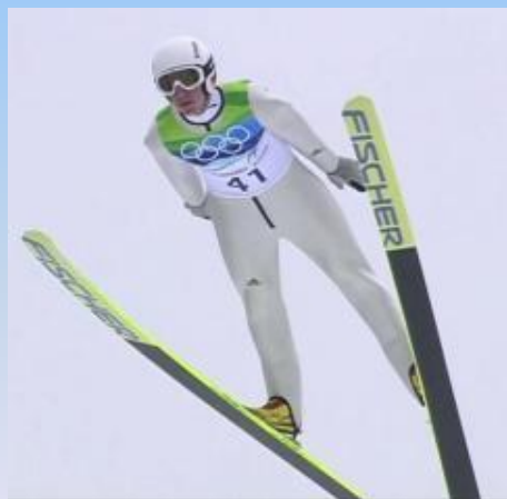
Прыжки с трамплина