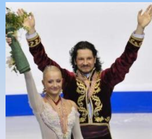
Оксана Домнина и Максим Шабалин