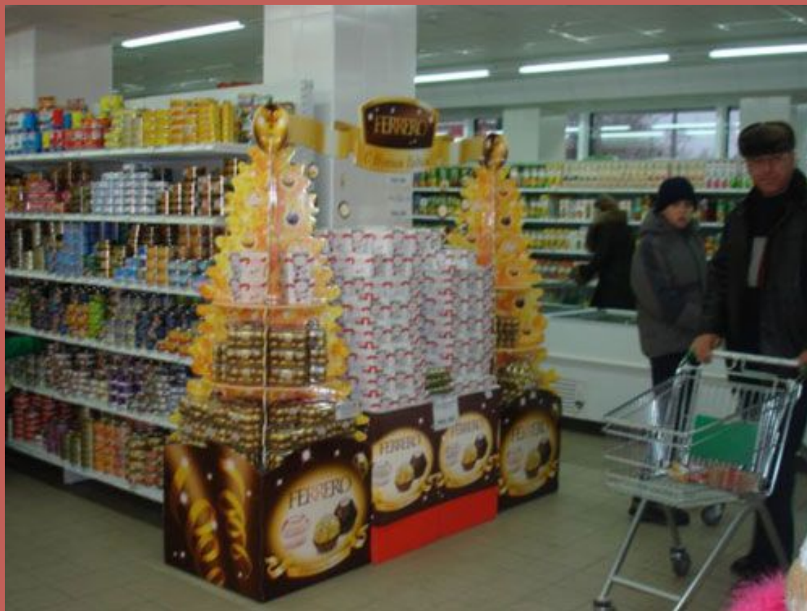
Декоративное оформление торцевых витрин