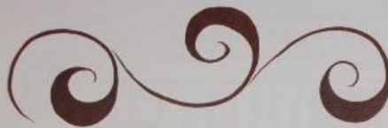
ВЕДУЩИЙ СТЕБЕЛЬ — «КРИУЛЬ»