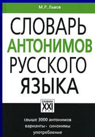
ЛЬВОВ М.Р. СЛОВАРЬ АНТОНИМОВ РУССКОГО ЯЗЫКА. М., 2006.