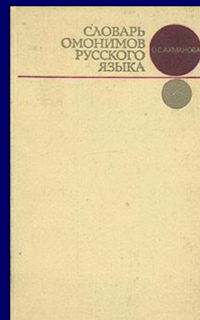
АХМАНОВА О.С. СЛОВАРЬ ОМОНИМОВ РУССКОГО ЯЗЫКА. М., 2002.