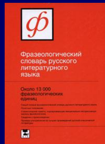
ФЁДОРОВ А.И. ФРАЗЕОЛОГИЧЕСКИЙ СЛОВАРЬ РУССКОГО ЯЗЫКА. М., 2001.