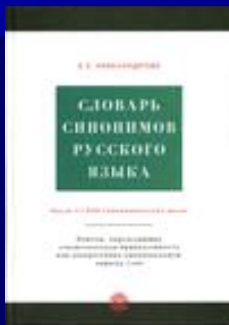
АЛЕКСАНДРОВА З.Е. СЛОВАРЬ СИНОНИМОВ РУССКОГО ЯЗЫКА. М., 2004.