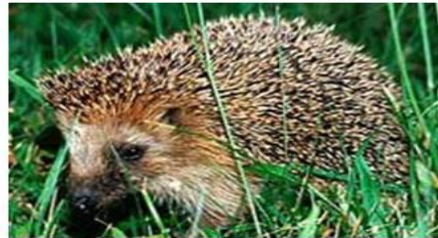
Иглы у дикобраза и ежа