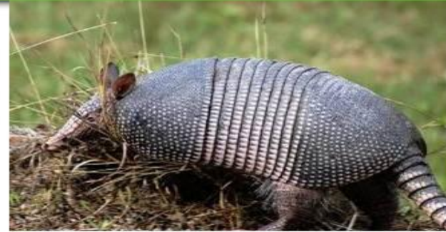
Панцирь у черепахи и броненосца