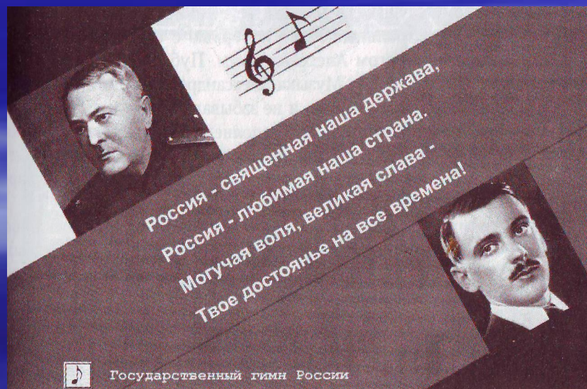
А.В.Александров, С.В. Михалков

К вопросу о гимне вернулись в 2000 году. Текст принадлежит С.В.Михалкову, а музыка осталась от прежнего гимна и принадлежит композитору и хоровому дирижеру А.В.Александрову. Государственный гимн РФ был утвержден Государственной Думой в декабре 2000 года. Текст гимна утвержден указом Президента РФ В.В. Путина 30 декабря 2000 года.